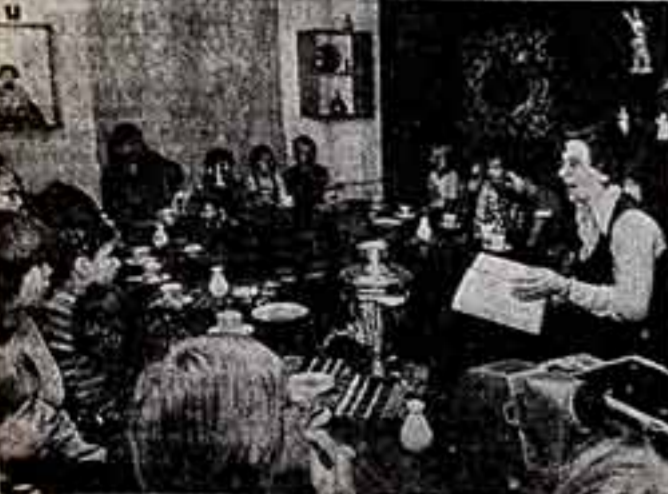
ГДР. Очень любят школьники младших классов берлинского района «Митте» свой Дом пионеров. И особенно его гостиную, где, собравшись за чашкой чая, они смотрят телевизор, слушают музыку или с интересом следят за приключениями сказочных героев.