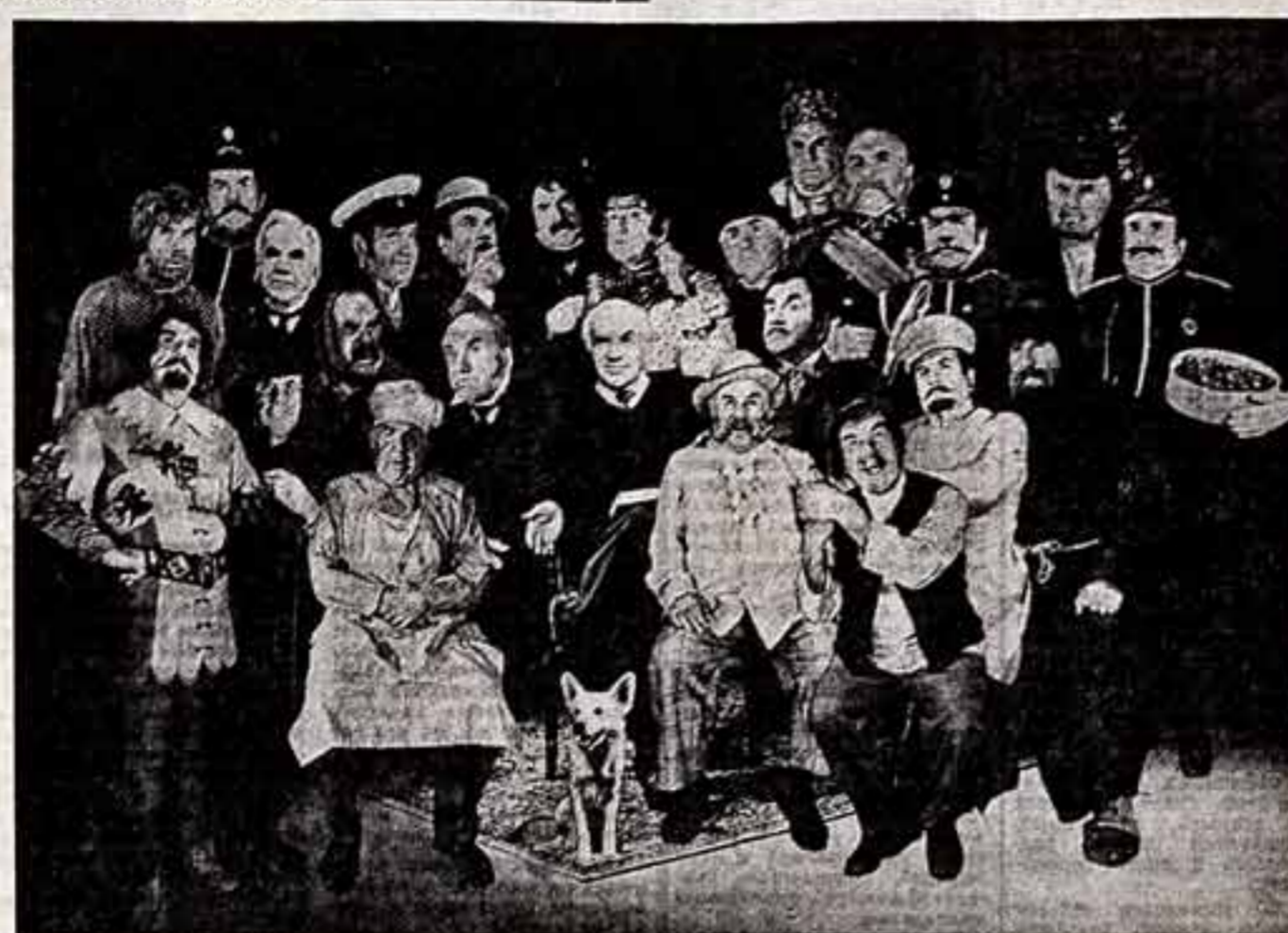
Вглядитесь в эту фотокомпозицию, напоминающую старинный семейный портрет в интерьере. Забавна толстая малява, значимый отец семейства, да странности пожиме друг на друга отпрыски и родичи — и в каждом вы узнаете одного так хорошо знакомого человека — Игоря Владимировича Ильичевского. Перед ним — его персонаж. Этот фотомонтаж, в сущности, взял того пути, который прошёл актер вместе с одинадцатой музой, история обретения веры в ее возможности, и значит, и помыслив требования и ее искусство. Фотокомпозиция А. Маршани.

С. ШЕРР, почетный член Общества охотников и рыболовов РСФСР.