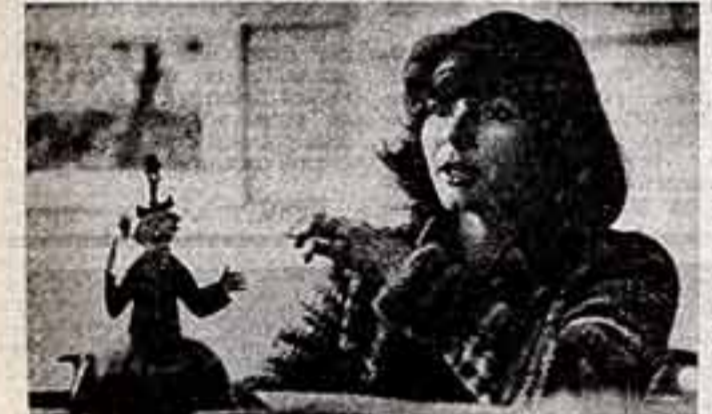
Объединение художественной мультипликационной Киевской студии научно-популярных фильмов выпускает 11-12 фильмов ежегодно по заказу Гостелерадио и для сатирического журнала «Фитиль».

Фильмы, снятые мультипликаторами объединения, неоднократно получали дипломы и медали многих всесоюзных кинофестивалей.