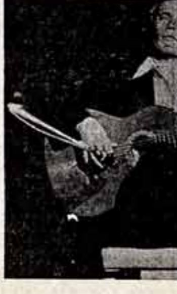
Пако де Лусия.

«Простите, я не узнал вас...» — Что же в этом удивительного! — Пако снова просто, как по-домашнему улыбнулся. — Я не Элиас Пресли. И не Пол Маккартни. Притом выступил я всегда в концертном костюме.»