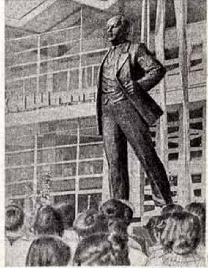
В день торжественного празднования 60-летия Ташкентского государственного университета имени В. И. Ленина в главном его корпусе воздвигнут памятник В. И. Ленину. Его автор — скульптор В. Клеванов и архитектор С. Сулягин.

Каждый год своеобразная артистическая флотилия отправляется по Оби. Очередная остановка в Колпашево. Группы Трудовой молодежи РСФСР. Танец с самодельными и исполнены самодеятельного коллектива села Большая. Зрители из Колпашево.