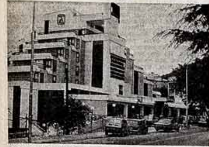
ЮГОСЛАВИЯ. Опатия — один из самых красивых курортов Югославии на Адриатическом море. Туристский сезон здесь продолжается круглый год. От зимних ветров здесь с севера прикрывают высокие горы. В сентябре 1894 года в Опатию приезжал лечиться и отдыхать А. П. Чехов. Он затем описал ее в рассказе «Архивариус».