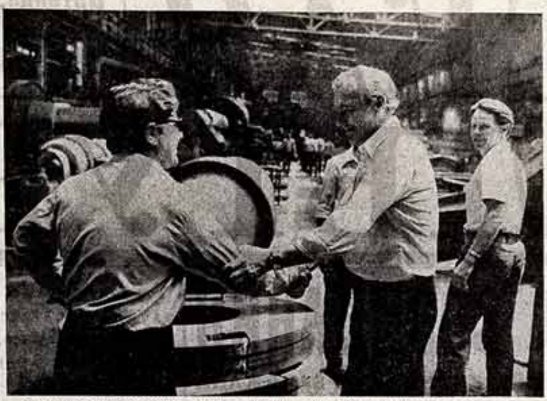
Крепкая дружба связывает коллектив Ленинградского академического Большого драматического театра имени М. Горького и производственное объединение «Империал завод». В гостях у рабочих актер театра, лауреат Ленинской премии, народный артист СССР Кирилл Лавров. Фото Ю. Великого [ТАСС].

ЦК Компартии Азербайджана и Совет Министров Азербайджанской ССР рассмотрели вопрос о совершенствовании книгоиздательского дела и укрепления материально-технической базы полиграфической и книжной торговли. Недостаточно выпускается книг, освещающих социально-экономические преобразования, обобщающих опыт организаторской и политической работы республиканской партийной организации. Все еще мало издается книг, посвященных актуальным проблемам коммунистического воспитания трудящихся, правовой, эстетической, детской и молодежной литературы. Существенные недостатки есть в книжной торговле, комплектовании библиотек, комплектовании междубюджетных этических изданий. В. ДМИТРИЕВА. БАКУ.