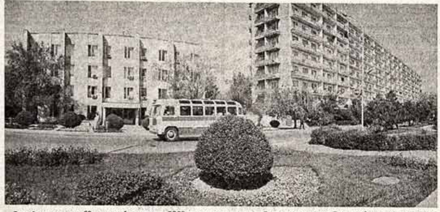
Достоиную встречу 60-летию образования СССР готовят труженники Ленинского района Баку — одного из старейших нефтедобывающих районов столицы республики. Семье пятидесяти лет назад району по пробы нефти начали присвоено имя В. И. Ленина. Тогда же вырос здесь первый рабочий поселок. За последние шесть лет в районе в эксплуатацию введены жилые дома общей площадью более ста тысяч квадратных метров.

● Новостройки поселят имени Степана Разина. Фото Ю. Разина и О. Литвина (ТАСС).