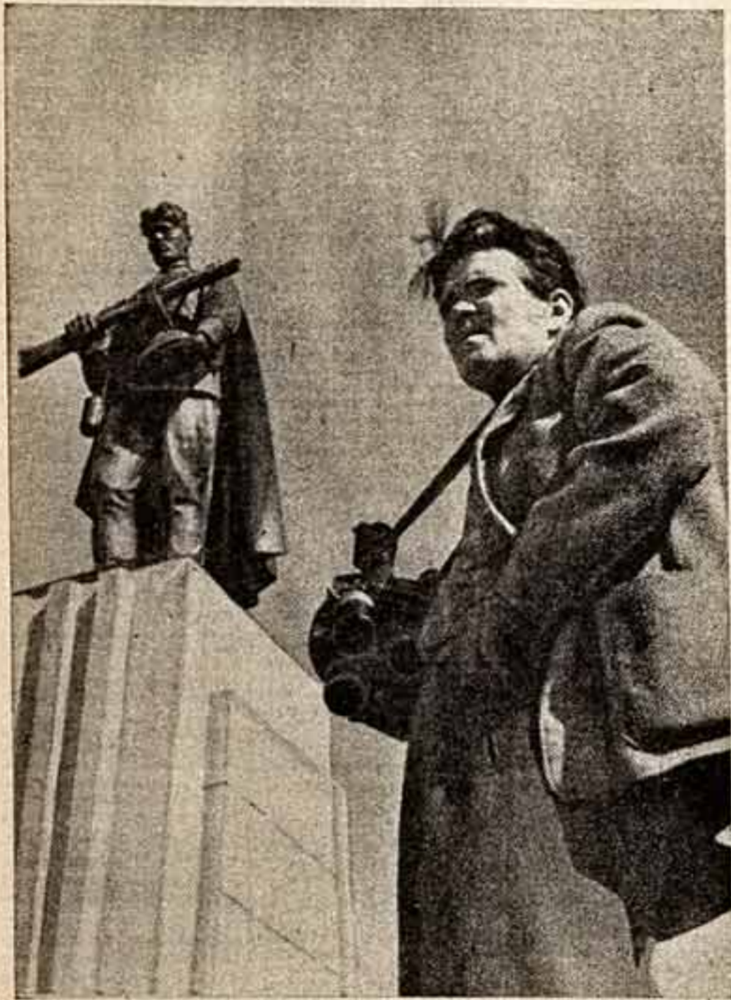
Свой новый фильм «Штабелям славы» белорусские киноактеры и режиссеры. На фото: оператор Г. Масальский на съемках «Штабелям славы».