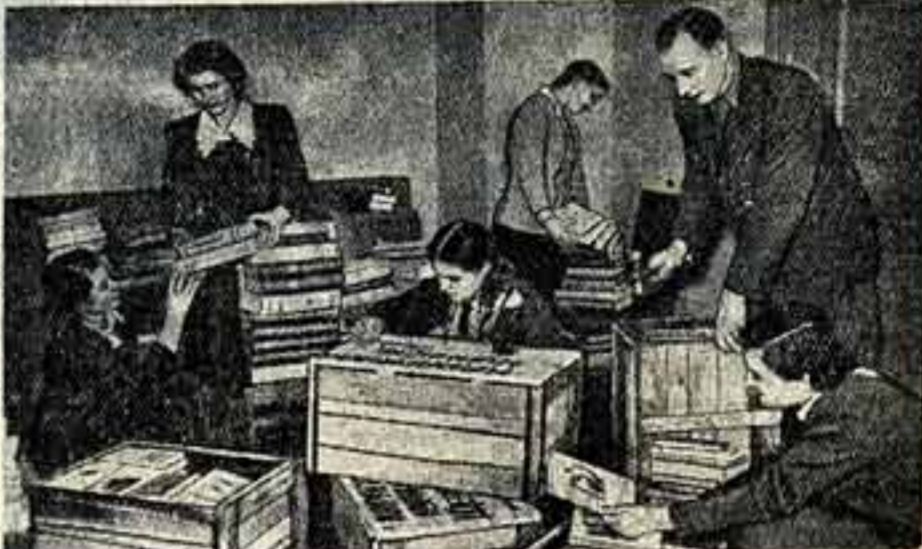
магнитофон и балы. Ученицы Художественного училища памяти 1905 года, чтобы были уютными жилища новоселов и их клуб, подарили им картины, а пионеркал и комсомольская организация 292-й школы — 800 томов различных книг. Отличной будет у совхоза библиотека. Много книг собрано для отрывающихся коллективных заводов, фабрик и учреждений района. Сотрудники библиотеки составили картотеку и привели все книги в порядок; по приезде на место библиотека сразу сможет начать работу.