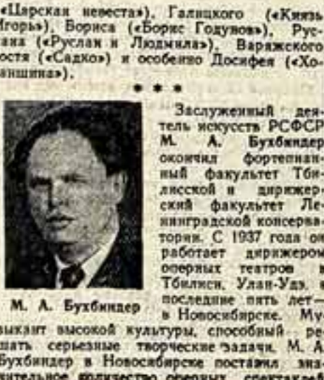
М. А. Бухбиндер