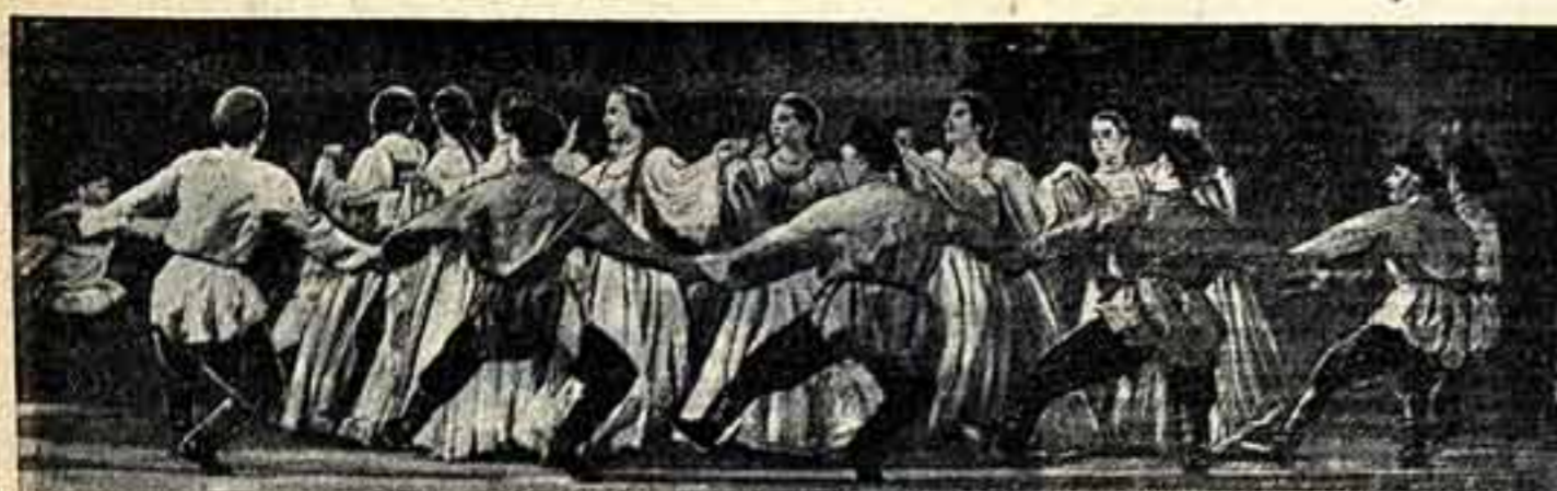
«Огневушка» — танцевальная картинка по сказу П. Бажова в исполнении танцевального коллектива учащихся учебных заведений трудовых резервов г. Свердловска.