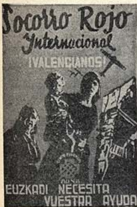
«Валенсийцы! Баскам нужна ваша помощь!» Плакат меканского МОПР.