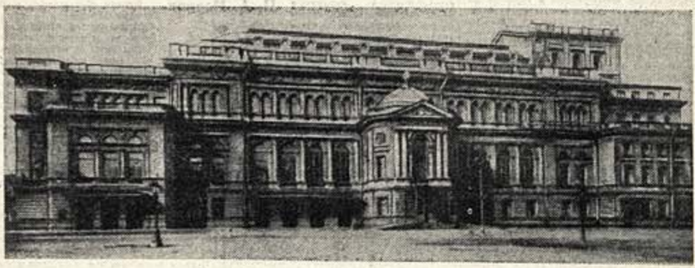
Здание Государственной ленинградской консерватории

На днях исполняется 75 лет со времени открытия Консерватории в Петербурге. Рановские музыковеды, искавшие подлинную музыкальную историю нашего народа, пытались свести к нулю великую роль консерватории в развитии русской музыкальной культуры. Не разобравшись толком в существе отношений отдельных деятелей «мелкой кучки» к консерватории профессионального музыкального образования в России Антону Рубинштейну, они, забыв о том, что он в противовес развитию русской музыки. Его деятельность, как основателя консерватории в России, она рационализируют как антинациональную. Эти горе-теоретики не понимали, что, несмотря на серьезные расхождения, существовавшие между Рубинштейном и «кучкой», все они вели к одной цели — созданию и развитию русской музыкальной культуры. Подлинное величие Рубинштейна состоит в том, что он первый в России понял необходимость профессионального музыкального образования. Отва от главы Консерватории, Рубинштейна с первых же шагов своей деятельности встретил сопротивление со стороны привилегированных кругов. Находясь на своем посту, он вывел из-под влияния «кучки» и других «оппортунистических покровителей», возглавлявших Императорское русское музыкальное общество (ИРМО), духа все начинавшие Рубинштейна, импрессионизма демократиче-