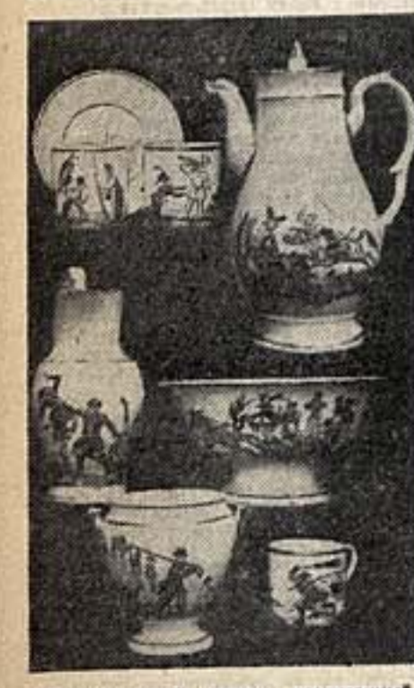
Гарднерский сервиз, расписанный миниатюрами на тему 1812 года.

Миниатюры написаны яркими наглазурными красками. Живописная техника довольно высока. Рисунки сделаны русскими крестовыми мастерами, работавшими на заводе Гарднера.