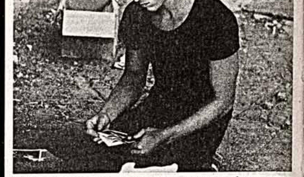
С одной стороны — повесть писателя-фантаста Бронислава Струпацкого «За миллиард лет до конца света», с другой — «Скользящий кинематограф» Александра Сокурова. Так родилась новая интеллектуальная картина «Дни заточения». Важ, уважаемые зрители, предостере...

В число «выдрок», которые отдадут перепахать, могут попасть тексты из десятого номера «Искусства кино».