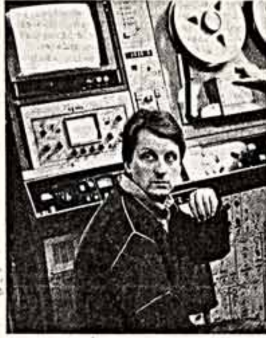
Режиссер Александр Бот