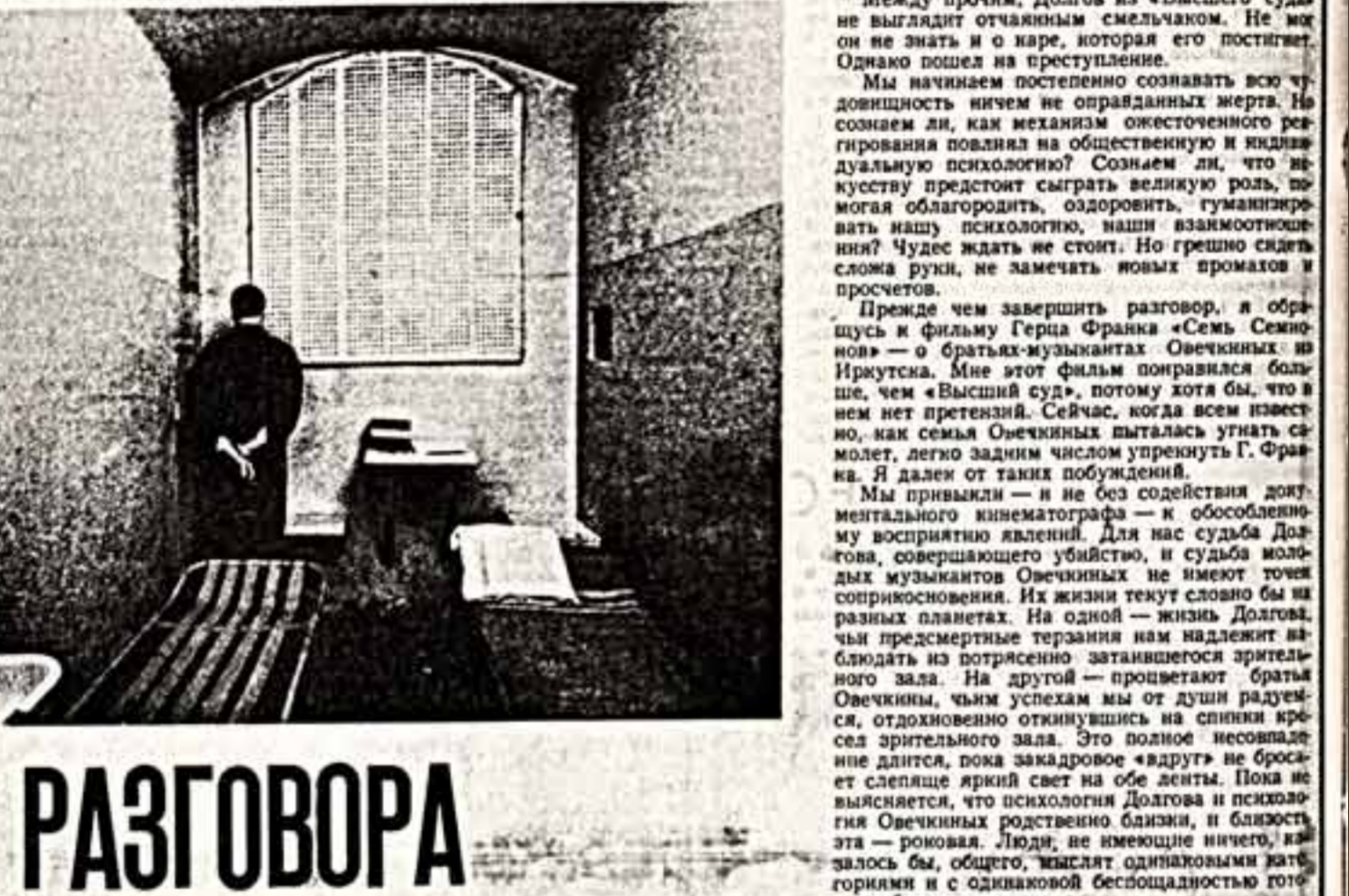
Между прочим, Долгов и «Вышний суд» не выглядят отчужденным смелым. Не молотом и не катком, которая его постигнет. Однако пошел на преступление...