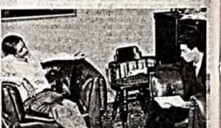
Телеспектакль о Ленине. Мы рождены революцией. Мы обращаемся в прошлое не из любви к прошлому...