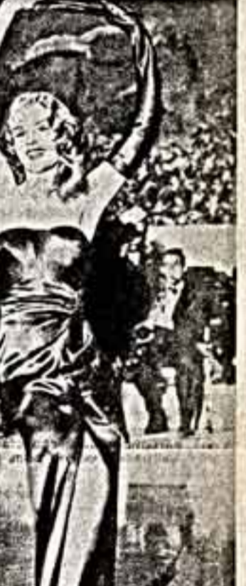
Рита Хейворт в роли Джильды в фильме «Восхождение актрисы на вершину славы»

Черный металлический корпус атомной бомбы, принесшей гибель тысячам японцев в 1945 году, как известно, был украшен портретами суперзвезд тех лет Риты Хейворт, Чарльза Боуэна и Джин Хепбёрн. Эта бомба с ядром из обогащенного урана была сброшена на Хиросиму.