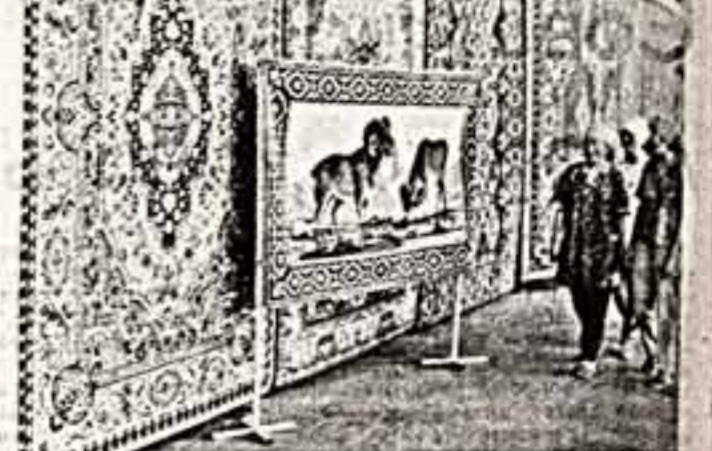
Проведения искусства по краю называют назвали хоророво колбана в городе Эрдэнэт. Это предприятие, построенное в долине советских специалистов...