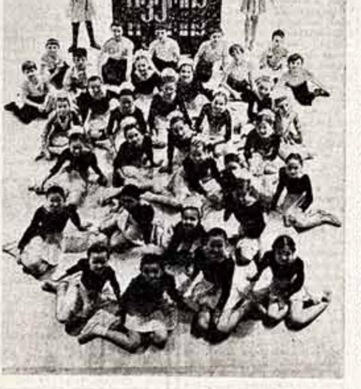
Артистам предоставляли все условия для занятий — в доме культуры «Юбилейный» 25-летние библиотечники, костюмерная, звуковая аппаратура...