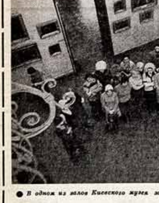
В одной из залов Киевского музея западного и восточного искусства.