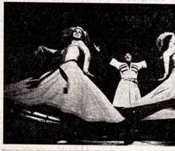
Около 500 человек — рабочие, студенты, школьники и совсем юные москвичи разных национальностей постигают секреты танцевального искусства в Центральном доме культуры «Юбилейный»...