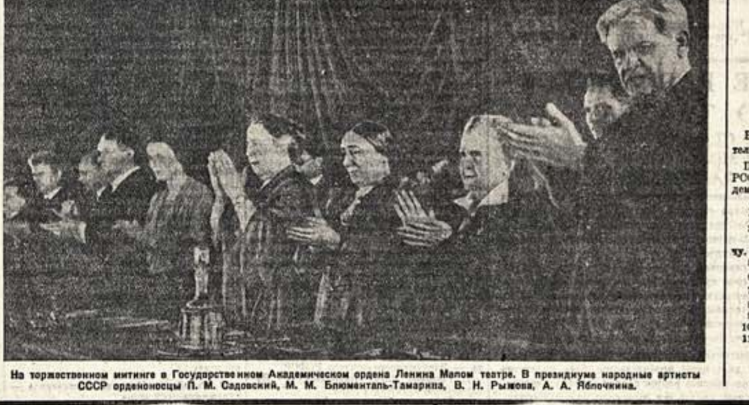
На торжественном митинге в Государственном Академическом ордена Ленина Малом театре. В президиуме народные артисты СССР орденосцы П. М. Садовский, М. М. Блюменталь-Тамарина, В. Н. Рязова, А. А. Ибюкиниа.