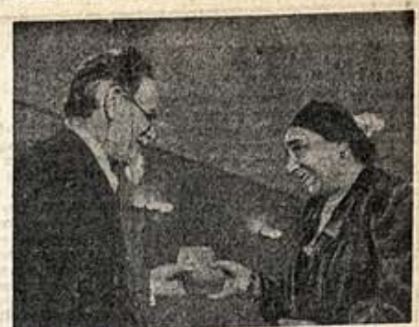
В праздничном ЦИК Союза ССР. М. И. Калинин вручает орден Трудового Красного Знамени народной артистке СССР В. Н. Рыковой