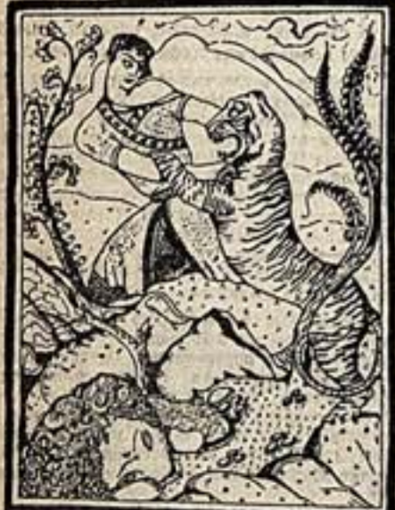
К 750-летию Шота Руставели. Из иллюстраций худ. Лео Гудышвили к юбилейному изданию «Витая в тигровой шкуре».

15 ноября в выставочных залах Музея им. Пушкина открылась всесоюзная выставка фотонискуства. Тема выставки — отражение в лучших произведениях фотографии-профессионалов и любителей экономической, культурной, политической жизни нашей страны. На выставке будет шесть отделов. Исторический отдел отражает борьбу за утверждение завоеваний Великой социалистической революции. Здесь большое место займут фотонискусцы, работавшие в годы Фотопролетариата Ленин и Сталин.