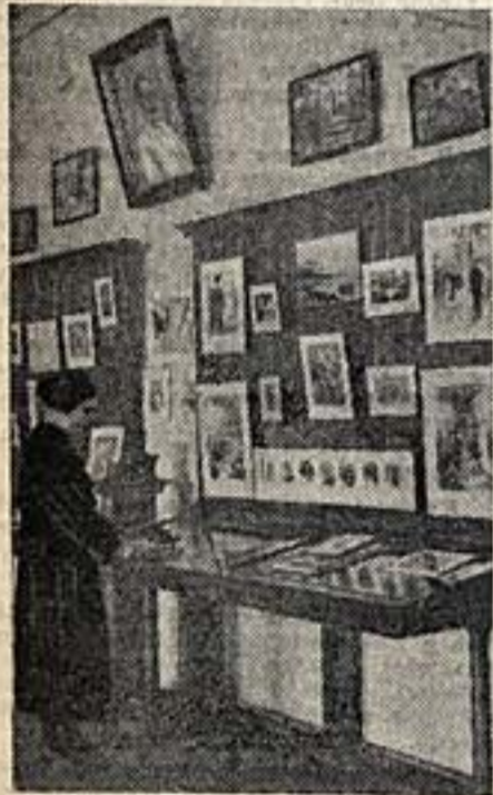
Музей М. Горького. 3-й зал (станд «Горький на Капри»).