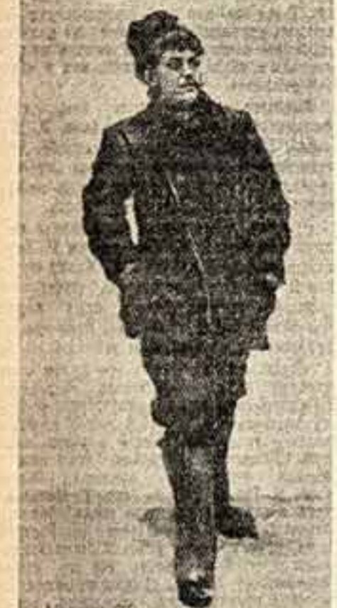
Н. Касаткина. Рабочий-художник. 1905 год.

Редакторам и художникам приходится применять всевозможные, часто очень смелые и остроумные уловки. Например, чтобы опубликовать в журнале призыв к бойкоту Государственной думы, редактор «Зритель» отослал посылку среди прочего материала три отдельных рисунка: «Бой» (мальчик-слуга), «Бот», «Табачный двор» (здание Государственной думы), а поместил их вместе, так что смысл этого эгирического ребуса был понятен каждому.