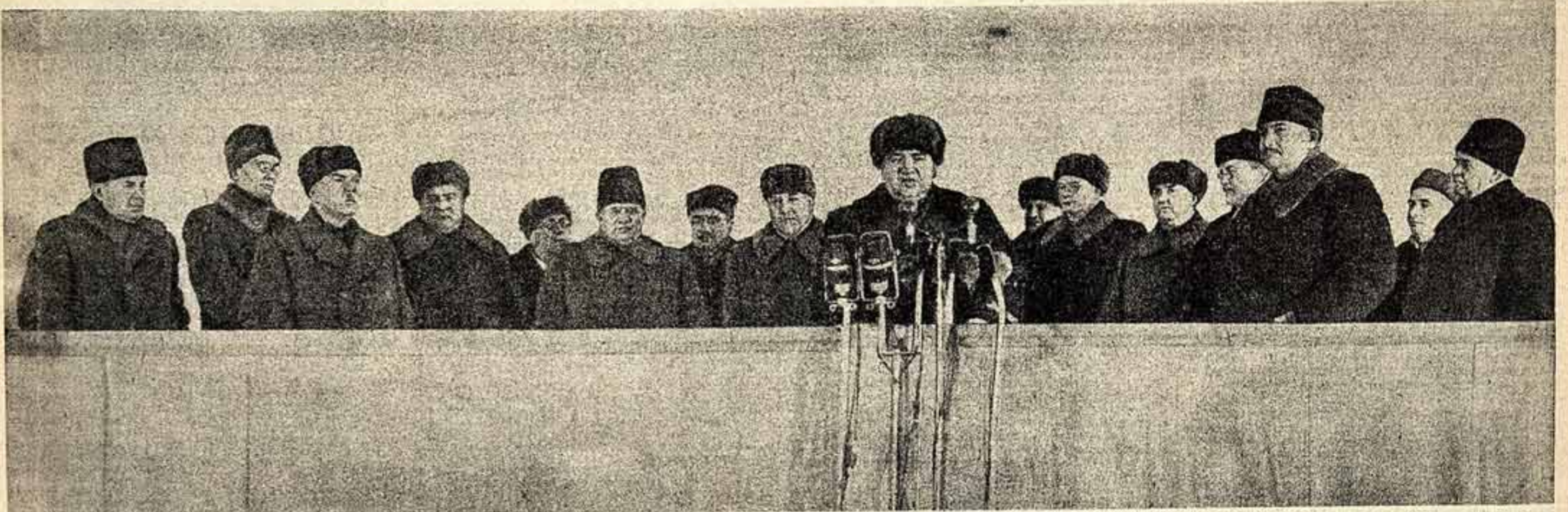
Прибытие в Москву Н. А. Булганина и Н. С. Хрущева после поездки в Индию, Бирму и Афганистан. Митинг на Центральном аэродроме. На трибуне (слева направо): товарищи М. З. Сабуров, М. А. Суслев, К. Е. Ворошилов, А. И. Кириченко, П. Н. Поспелов, Н. С. Хрущев, А. И. Микоян, Н. А. Булганин, М. А. Яснов, Н. И. Беляев, М. Г. Перухин, Г. М. Маленков, В. М. Молотов, Л. М. Каганович, А. Б. Аристов, Н. М. Шверник.

Вчера сотни тысяч трудящихся восторженно встречали Председателя Совета Министров СССР, Н. А. Булганина и Члена Президиума Верховного Совета СССР Н. С. Хрущева, возвратившихся в Москву после плодотворной поездки в Индию, Бирму и Афганистан.