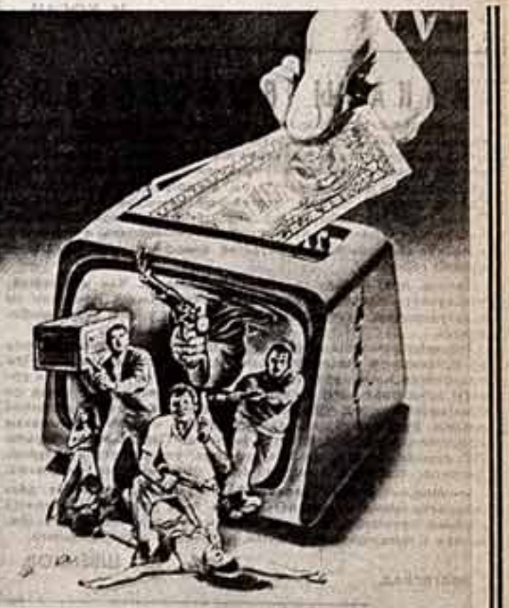
ПОСТОЯННОЕ «ПИТАНИЕ» АМЕРИКАНСКОГО ТЕЛЕВИДЕНИЯ.

составная часть процесса дегуманизации, морального и духовного разложения и психического насилия. Ее социальная роль — одурманивание широких масс, средство направленной революционной энергии жертв капиталистической эксплуатации на путь отдельных анархических взрывов, актов индивидуального террора. «Проводя деление, — пишет газета американских трудящихся «Дейли уорлд», — готовит почву к появлению во времена кризиса черноты, с силой в поддержку самой оголтелой реакции. Пульс насилия — распад реакционных, пессимистических идей о роли человека и общества, служивший поводом борьбы капитализма за утверждение нового социального строя». Г. ШИШКИН, корр. ТАСС — специально для «Советской культуры», Нью-Йорк.