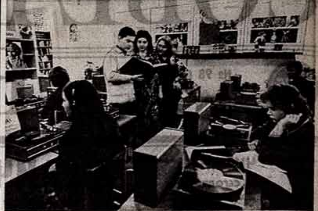
Дом № 4 по Большой Чернышевской улице в Москве посещают более 35 тысяч читателей в возрасте от 14 до 30 лет. И каждый выводит себе записку по своему вкусу. Здесь, в Государственной юношеской библиотеке РСФСР имени 50-летия ВЛКСМ, проводится «Голубые огоньки», «КВН», действуют самые различные клубы по интересам. В эстетическом центре библиотеки ведется большая работа по привлечению молодежи к миру прекрасного.

Президиум Верховного Совета РСФСР за заслуги в области советского киноискусства присвоил почётное звание заслуженного деятеля искусства РСФСР Чешеву Ивану Ивановичу — кинооператору Дальневосточной студии кинохроники, Хабаровский край.