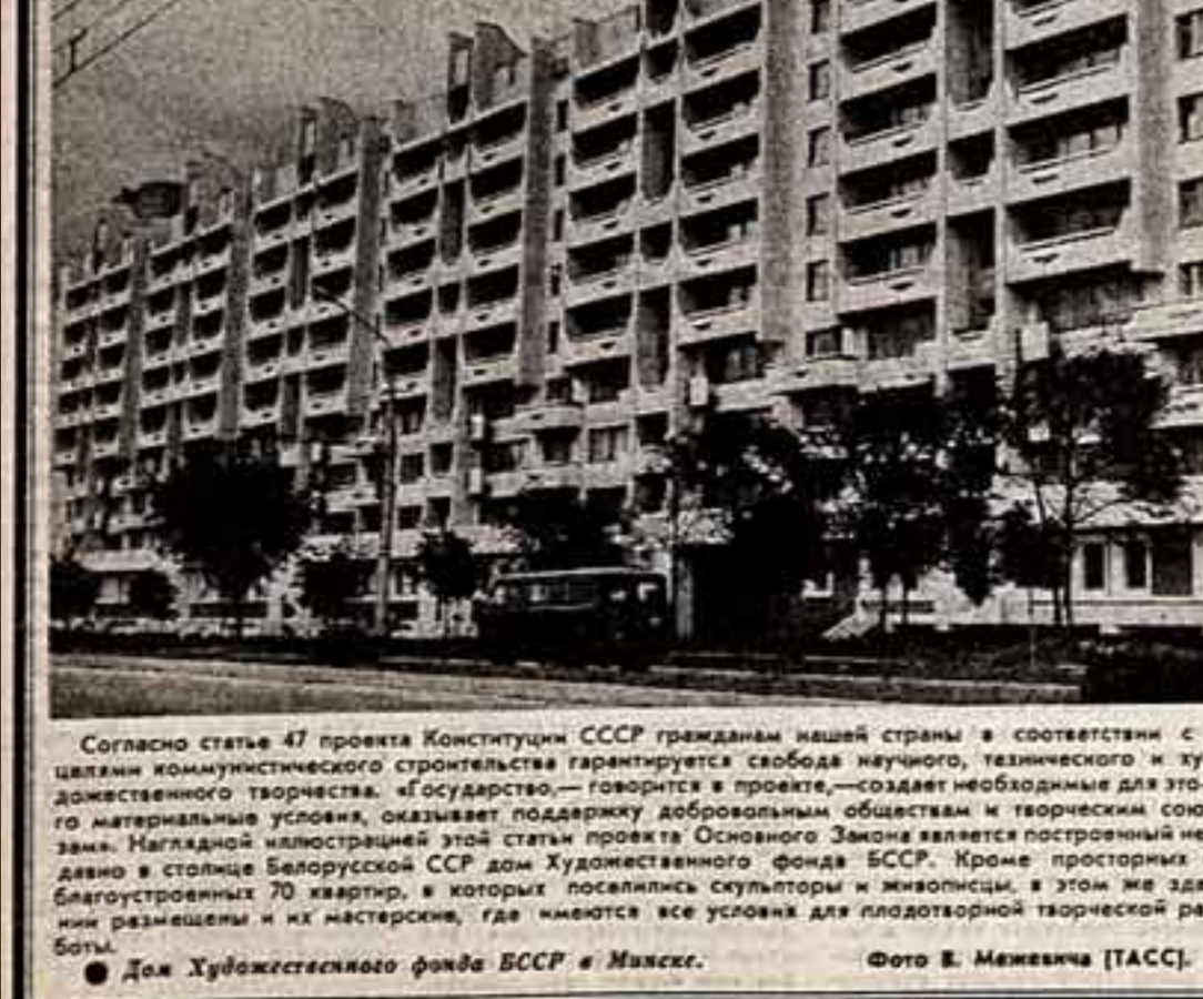
Согласно статье 47 проекта Конституции СССР гражданам нашей страны в соответствии с целями коммунистического строительства гарантируется свобода научного, технического и художественного творчества. © государство... — говорится в проекте, — создание необходимых для этого материальных условий, оказание поддержки добровольным объединениям и творческим союзам. Наглядной иллюстрацией этой статьи проекта Основного Закона является построенный и благоустроенный 30 квартир, в которых поселились скульпторы и живописцы, в этом же здании размещены и их мастерские, где имеются все условия для плодотворной творческой работы.

Мне хочется выразить уверенность в том, что проект Конституции СССР является нравственным кодексом конца XX — начала XXI века. Разумеется, невозможно в одном документе охватить все, потому что закончик и в то же время точки осмысления его положения.