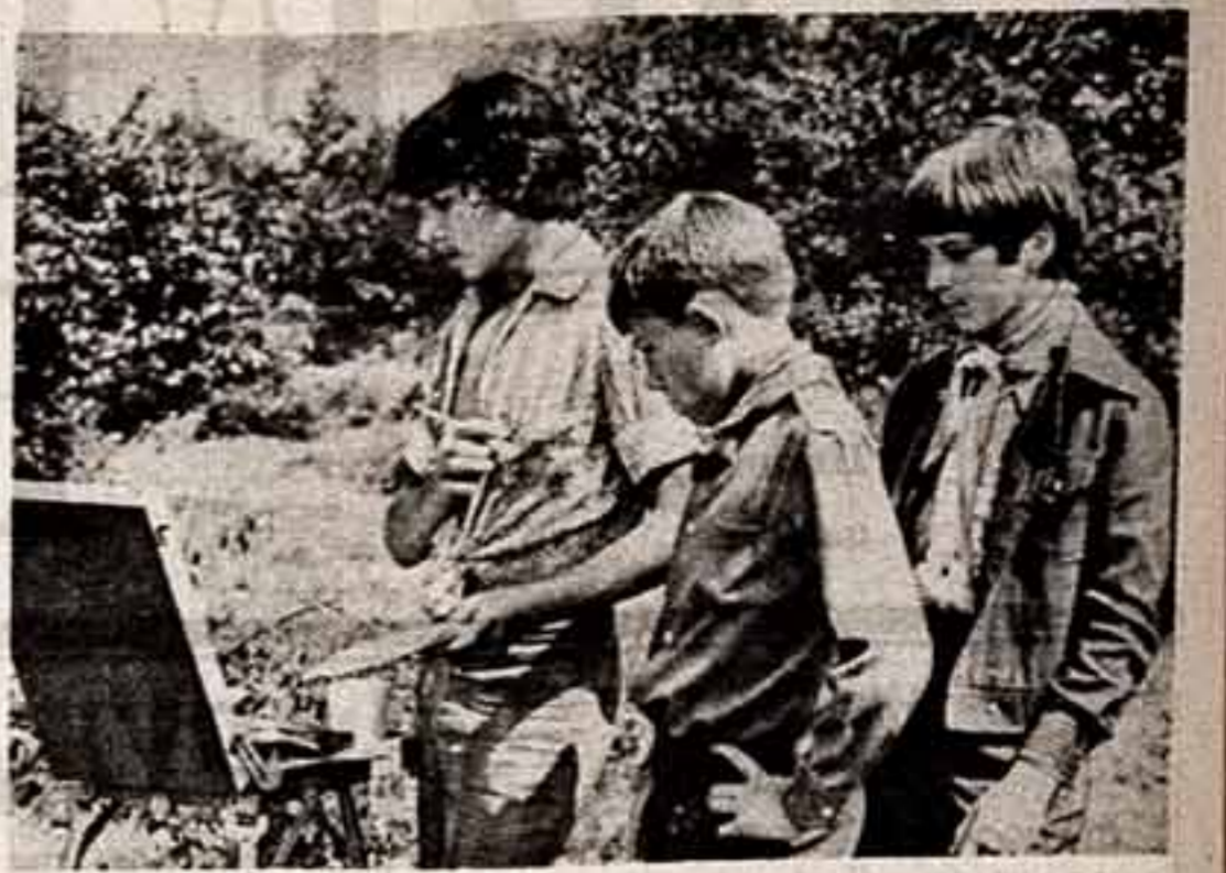
На окраине закарпатского города Свалява Украинской ССР в живописной горной долине раскинулся республиканский пионерский лагерь «Юный художник»...