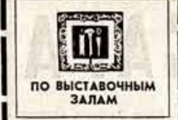
ПО ВЫСТАВОЧНЫМ ЗАЛАМ

Так называется красочная художественная выставка, посвященная 60-летию советской милиции, открывшаяся в Барнауле. Портреты, анимационные работы, графика, скульптурные произведения — все их можно было бы обобщить одним названием: «Душа милиции». Художникам удалось запечатлеть своих героев в моменты не самых ярких графических работ Ю. Кабанова, оформив В. Тунова и А. Поталова, живописное полотно П. Панарина. Даже театральные художники не остались в стороне от выставки, представив эскизы и спектаклем, посвященным работникам милиции. О. АЛЕКСАНДРОВА, наш соб. корр. ВАРНАУЛ.