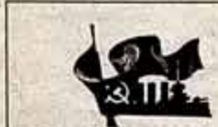
НАШ ОБРАЗ ЖИЗНИ