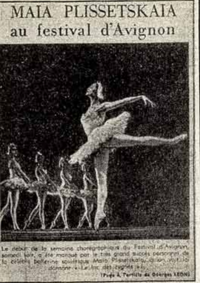
Le debut de la troupe chorégraphique du Festival d'Avignon...