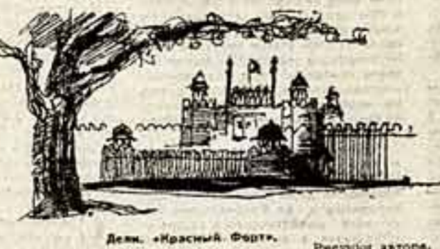
Дели. «Красный Форт». Рисунок автора.