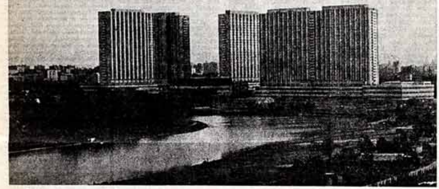
Гостиничный комплекс в Измайлово.