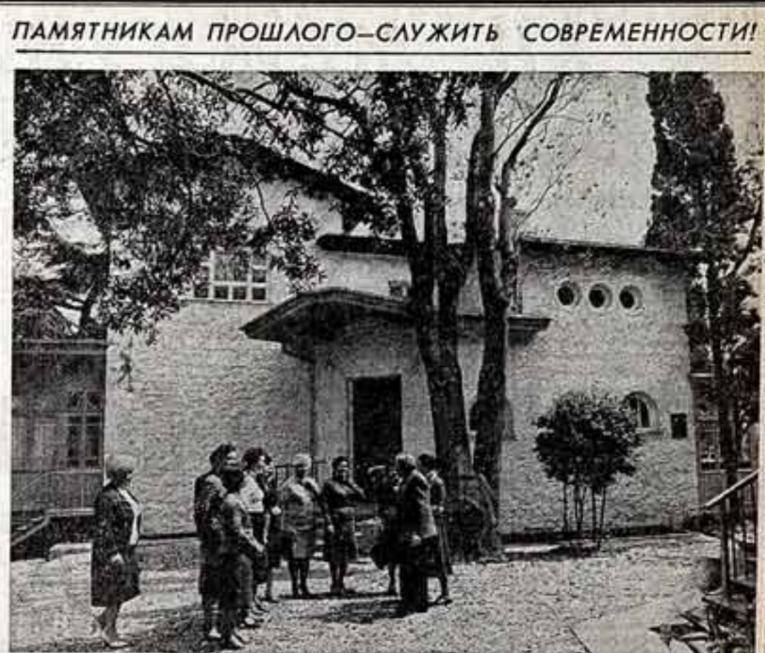
Большим праздником русской культуры стал недавно 60-летний юбилей Дома-музея А. П. Чехова в Ялте. Сотни людей ежедневно проходят по аллеям прелестного чеховского сада, знаменитого с домом, где жил и работал великий русский писатель. Год назад музей был открыт после реконструкции. Стены традиционными чеховские чтецы.