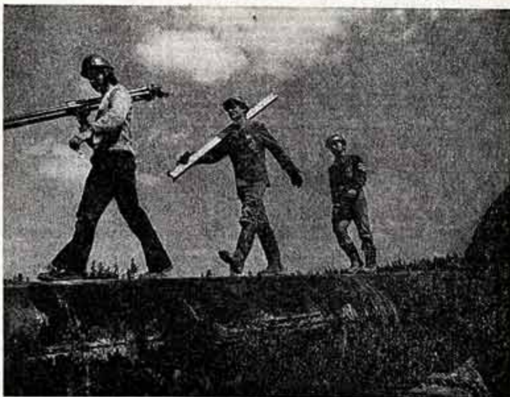
Лето в Сибири — жара десантов. На стройке один за другим прибывают студенческие строительные отряды, а города и поселки, на трассах строящихся газопроводов и железнодорожных путей — технические группы театров и филармоний со всех концов страны.

● На трассе газопровода Уренгой — Сургут — бойцы студенческого строительного отряда из Львова.