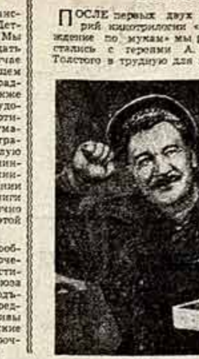
После первых двух серий кинотрилогии «Жизнь по мукам» мы расстались с театром А. Н. Толстого в трудную для них пору. Захватывающие искристые образы исторических событий, которые перевернули мир, о людях, о...