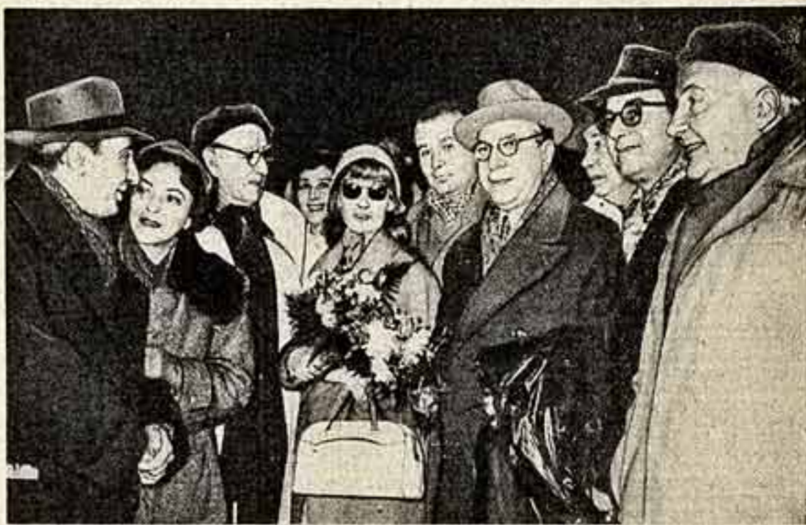
Встреча артистов Театра имени И. Л. Караджале на Курском вокзале в Москве.