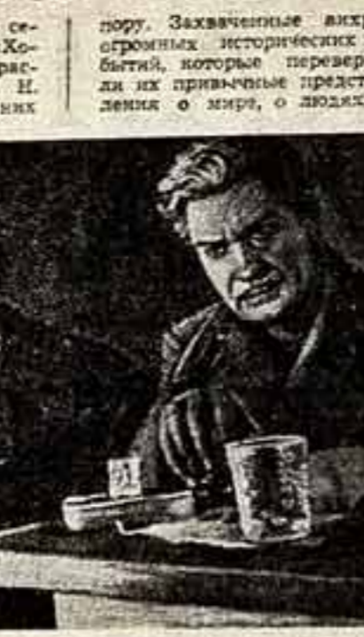
В многолюдной и разногласной толпе раздается Катю. Вдруг все мгновенно разбегается, площадь, где только что была обстановка, где только усталость, пустота, один Родина, ничего не замечая, продолжает свой путь. Навстречу ему на велосипеде — маленький и худенький человек с длинными волосами. Сухие, вымученные глаза остановились на Родине, и он вынул из кармана записку, которую он только что написал. Так Родина попадает в «армию» батальона Мухоморова.

После первых двух серий кинотрилогии «Жизнь по мукам» мы расстались с театром А. Н. Толстого в трудную для них пору. Захватывающие искристые образы исторических событий, которые перевернули мир, о людях, о... Катю. Вдруг все мгновенно разбегается, площадь, где только что была обстановка, где только усталость, пустота, один Родина, ничего не замечая, продолжает свой путь. Навстречу ему на велосипеде — маленький и худенький человек с длинными волосами. Сухие, вымученные глаза остановились на Родине, и он вынул из кармана записку, которую он только что написал. Так Родина попадает в «армию» батальона Мухоморова.