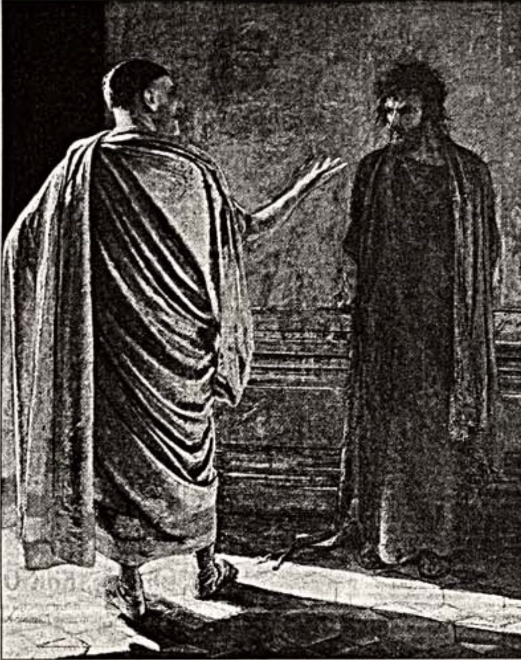
Н.Ге. "Что есть истина?". 1890 г.

противопоставлено образу Христа. Творческий путь Ге не совпадает с этапным развитием русского искусства.