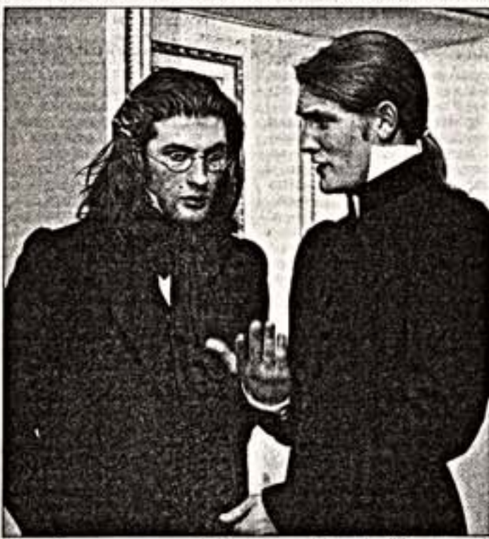
Сцены из спектакля "Самозванец" (слева) и "Горе от ума"