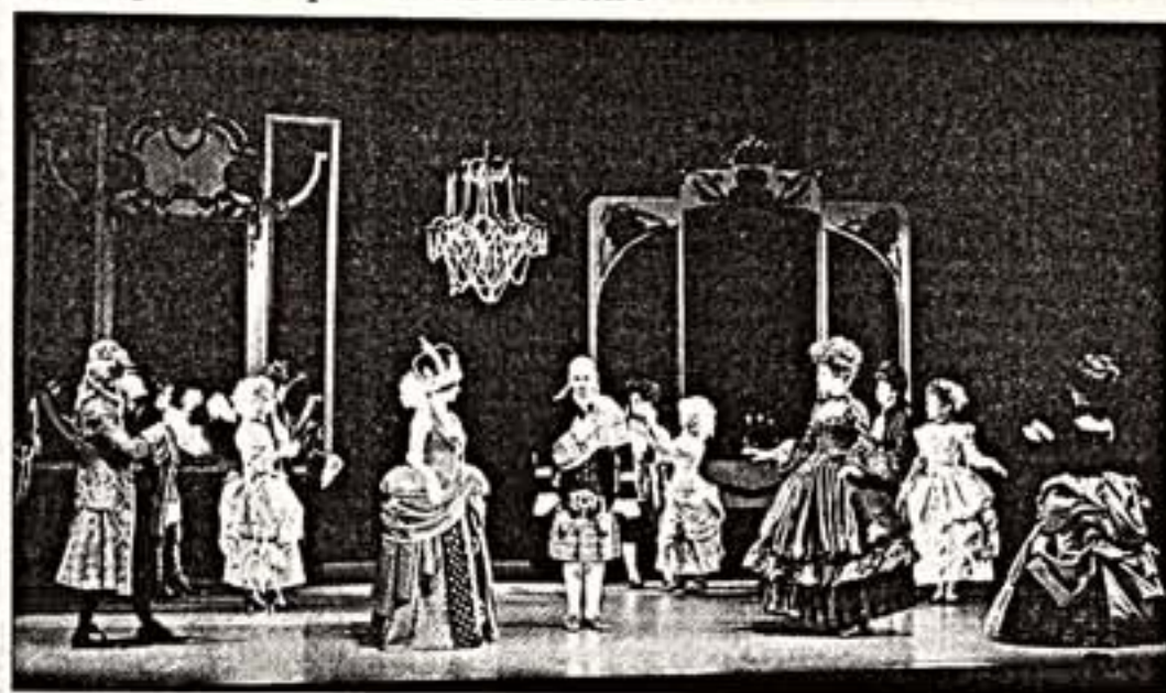
Сцена из спектакля "Прыжки и следствия, или Станок воды"

Хотя, конечно, это зрелище привлечет толпы зрителей публике. Главное — не останавливаться на дости-