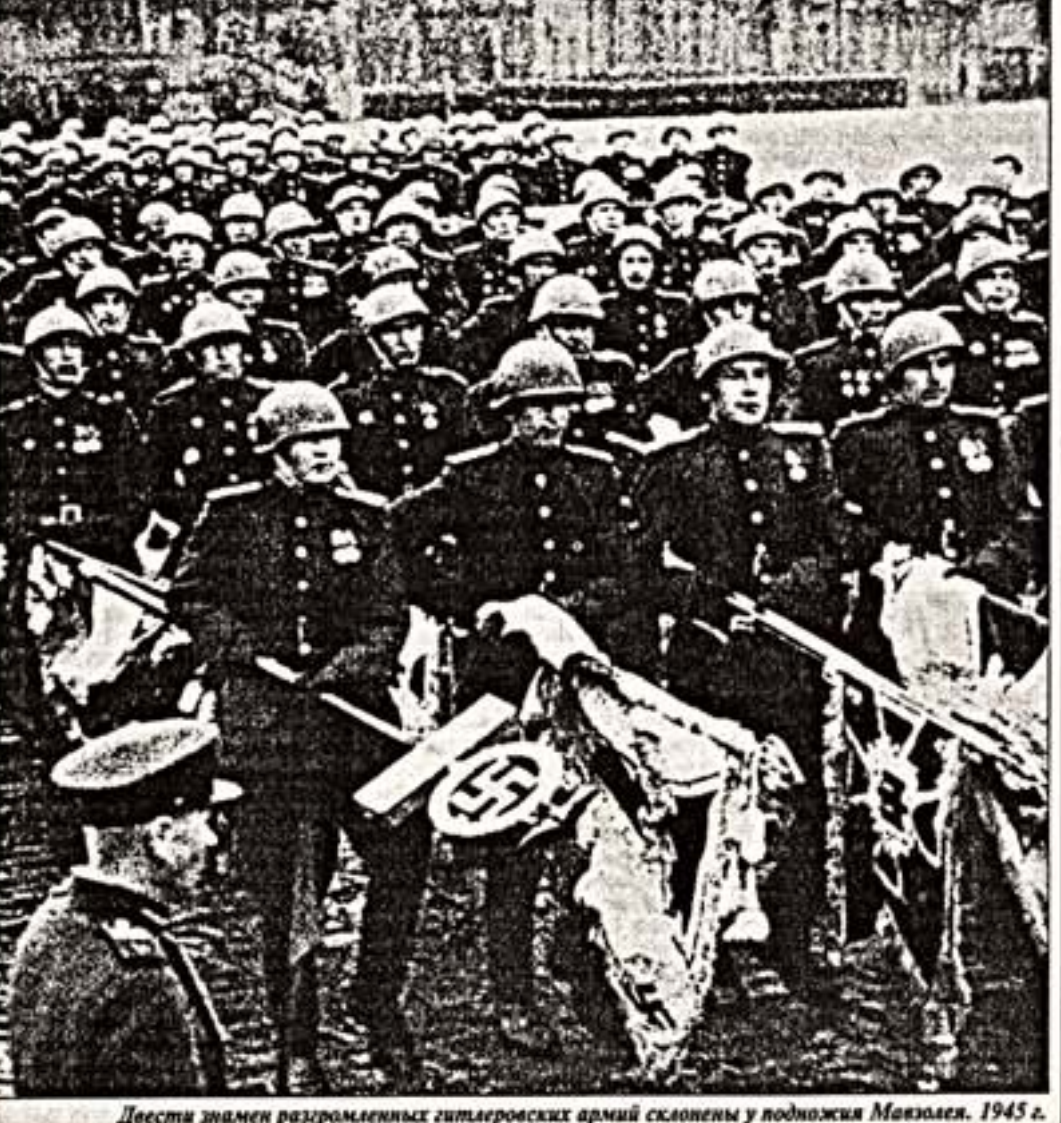
Десятки знамен разгромленных гитлеровских армий сложены у подножия Мавзолея. 1945 г.