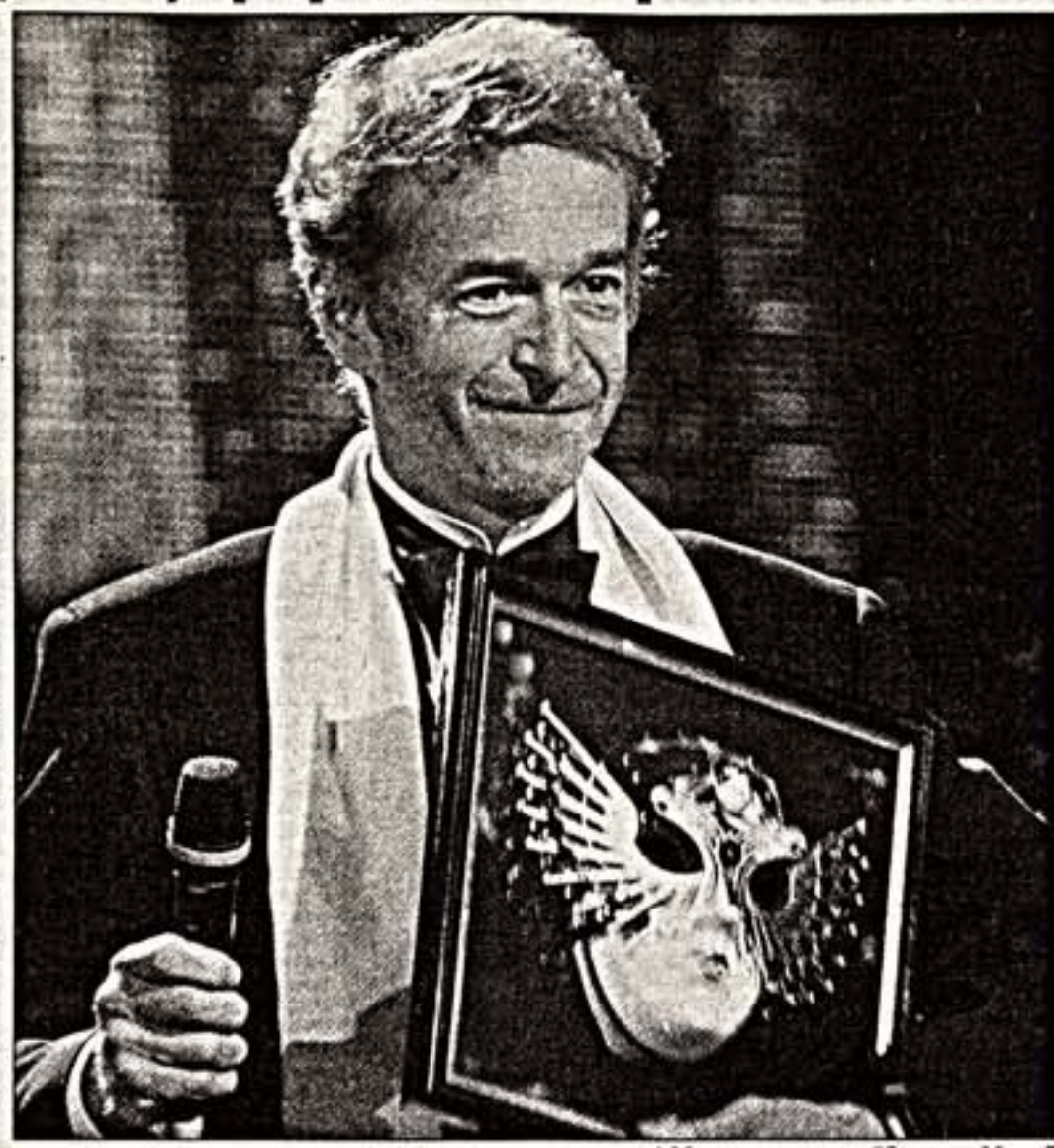
А.Маратра получает "Золотую Маску"