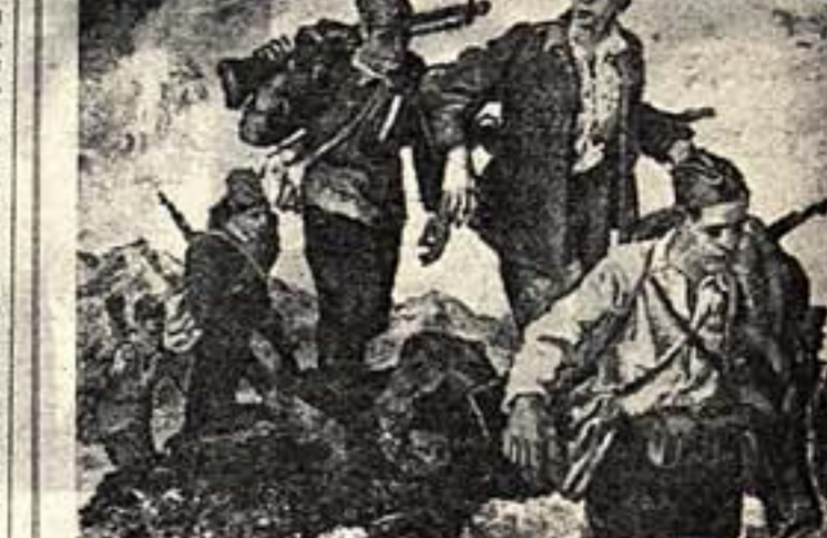
«Партизанский отряд». Художник Д. Андреевич-Кун.

Вчера в Москве открылась выставка изобразительного искусства Югославия, организованная Комитетом по делам искусств при Совете Министров СССР в Всесоюзном обществе культурной связи с заграницей.