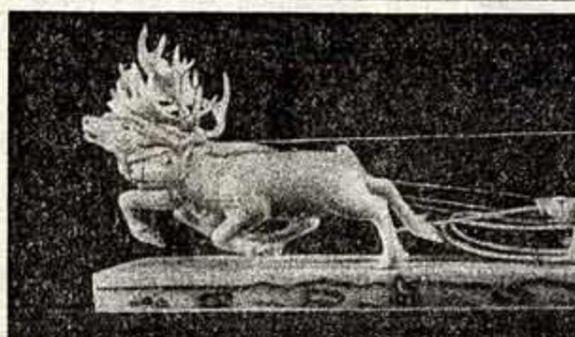
Прекрасные фигурки из морского янтаря вырезают резчики Узлена — поселка на самом краю Чукотки. Им этого маленького населенного пункта, приютившегося на узкой ноге острова, известно Парину и Лондону, Нью-Йорку и Брюсселю. Тонко и тонко, Осага — седьмой зарубежный город, где широко представлены произведения узленских художников.