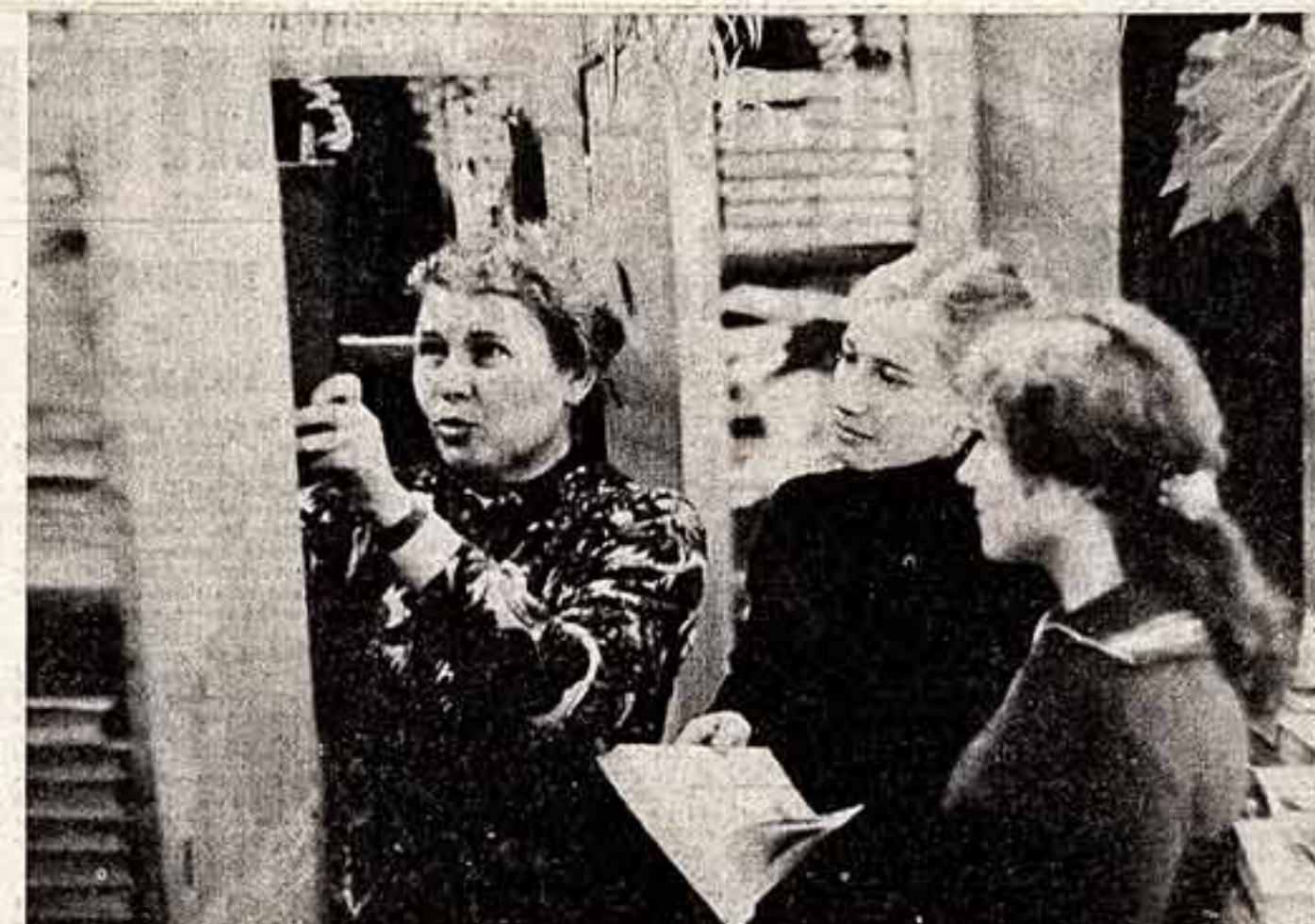
Этот список обещан в библиотеке Московского лесотехнического института. Библиотека большая — 650 тысяч томов художественной, политической и специальной литературы. По этому внушительному книжному морю может быстро проплыть только опытный лодочник, каковым и является библиотекарь Л.Изен, работающая здесь вот уже 30 лет.

А. ПУРТОВ, пос. ПАЛЕХ, Ивановская область.