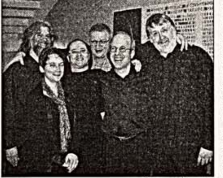
В кулуарах фестиваля