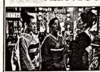
Ровно через год после мировой премьеры телезрители смогут увидеть нашумевшую романтическую драму "Мемуары гейши" ("The Geisha Boy").