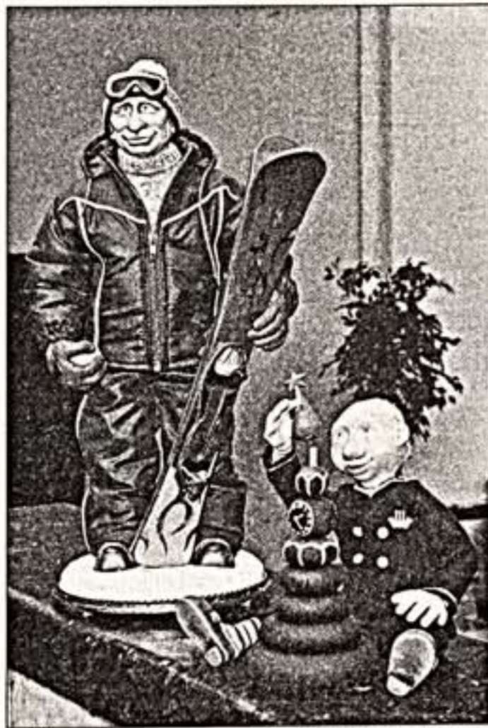
На выставке "Парад звездных кукол"; "Пушин-горныльщик" и "Пушин-ребенок" (слева) и "Шоу" и "Шоу"