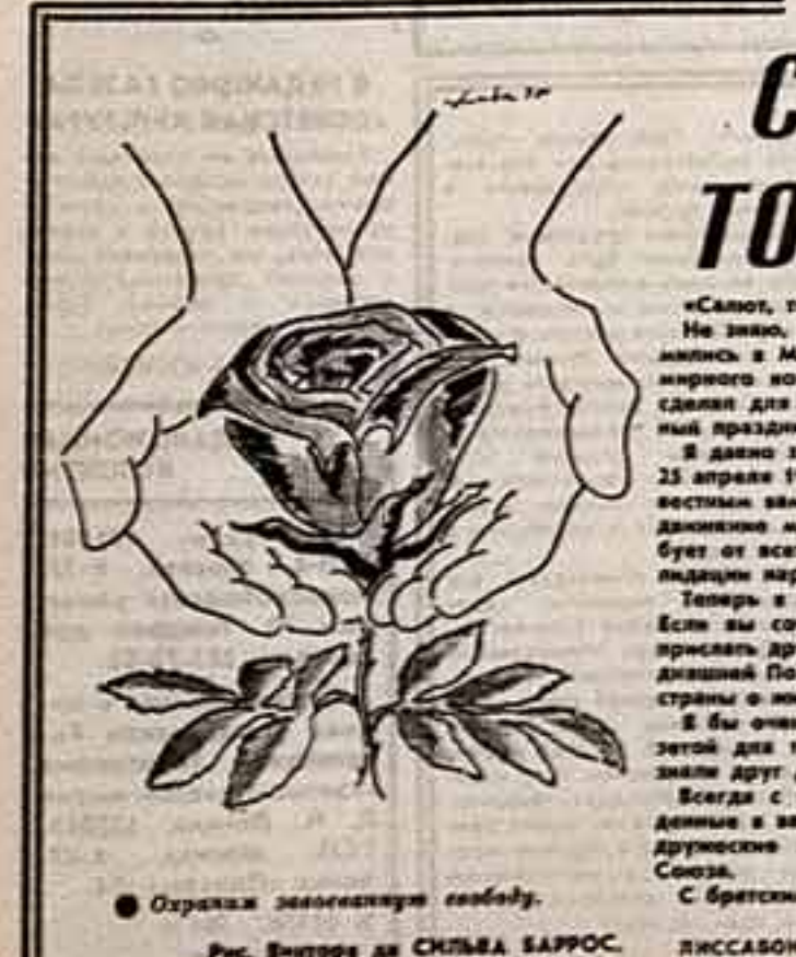
Отрада замолчанной свободы. Рис. Виктор де СМЛВА БАРРОС.

Обширная программа деятельности общества в этот год: Во Францию состоится Движение СССР, в которых будут участвовать художественные коллективы Казахстана и Украины. Собирается за круглым столом мадрид, в Париже с отменным визитом приедут деятели советского театра. Намечена двусторонняя встреча представителей порочившихся городов. И, конечно, особое место занимает мероприятие в честь 50-летия Победы над фашизмом. В Париже в мае побывает группа советских ветеранов войны, в нашей стране состоится встреча молодежи двух стран, посвященная этой знаменательной дате. Хочу особо подчеркнуть, что улучшение отношений между нашими странами по государственной линии дает новый толчок деятельности общества.