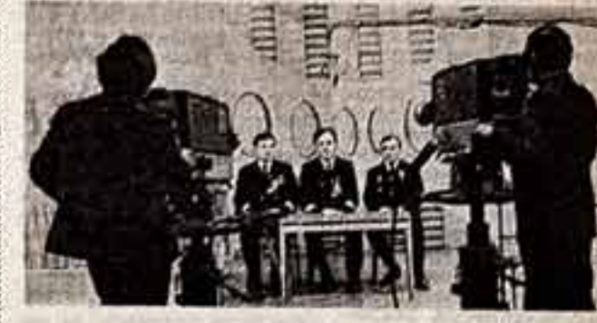
Южно-Сахалинск. «Капитанский час» — так называется популярная телепередача сахалинского телевидения. ● Участники телепередачи «Капитанский час».

20 марта в Кремле начались переговоры между членом Политбюро ЦК КПСС, Председателем Совета Министров СССР А. Н. Косыгиным, членом Политбюро ЦК КПСС, министром иностранных дел СССР А. А. Громыко и Премьер-Министром Франции Ж. Шираком.