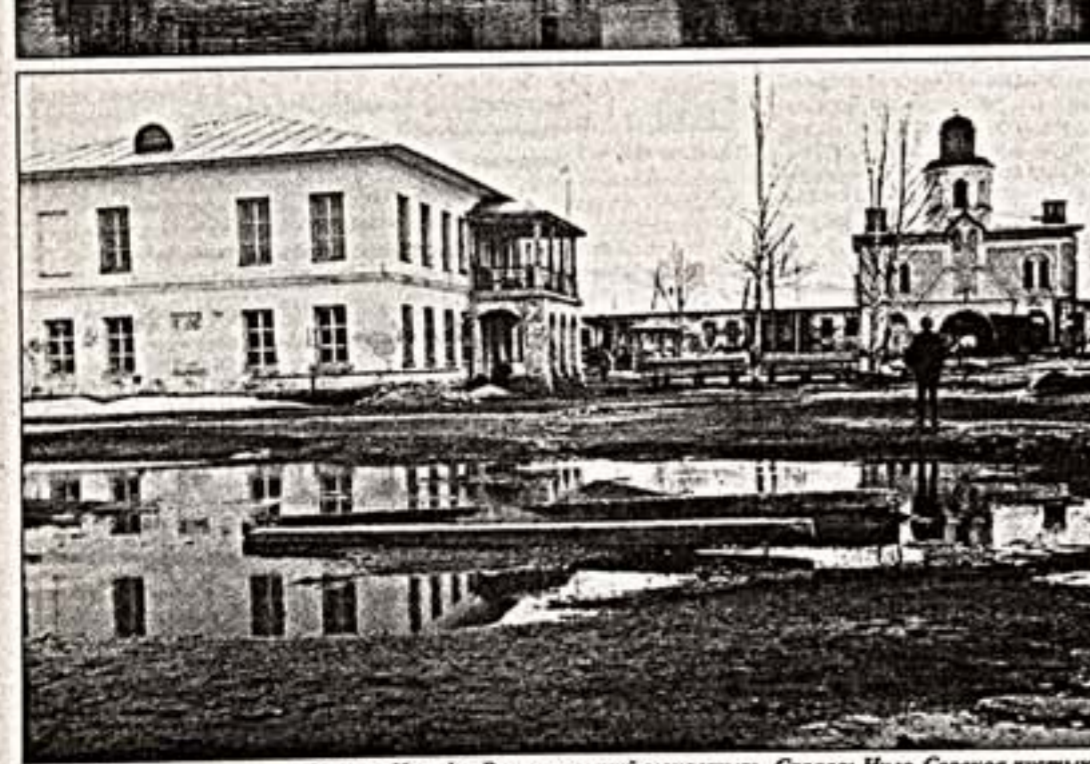
Вверху: Носифо-Волоколамский монастырь. Справа: Нило-Сорская пустынь

"Устав о святой жизни" преп. Нила Сорского, изложенный архимандритом Иустинианом, гласит: "Иосифа Волоколамца, которого возлюбил св. Нил Сорский, Пансий Ярославский, Дионисий Святотроцкий, св. Кассиан Учинский и св. Инокентий Комельский, становится предметом упоминания уже после Московского собора 1503 года..."