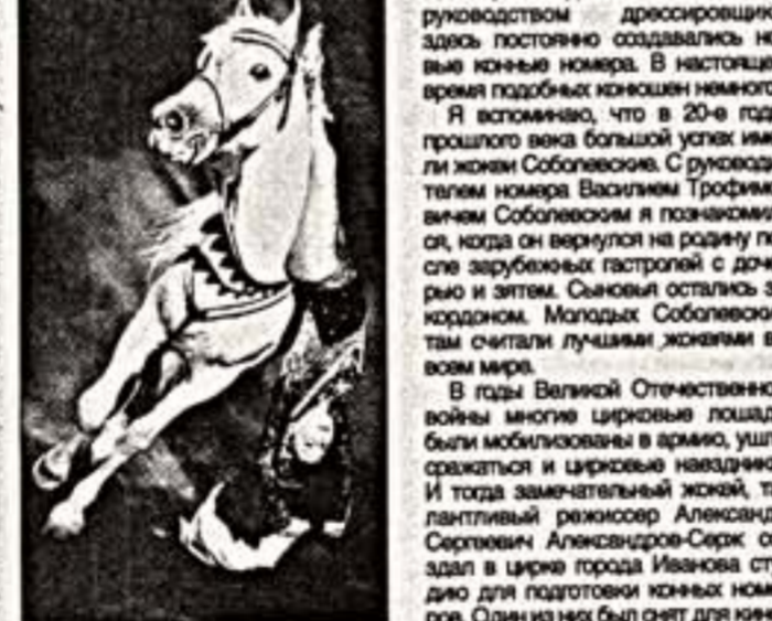
Стационарах на всем протяжении сезона, а иногда и несколько. Под руководством дрессировщика здесь постоянно создавались новые конные номера...

Цирковая арена может лишиться своих самых ярких номеров