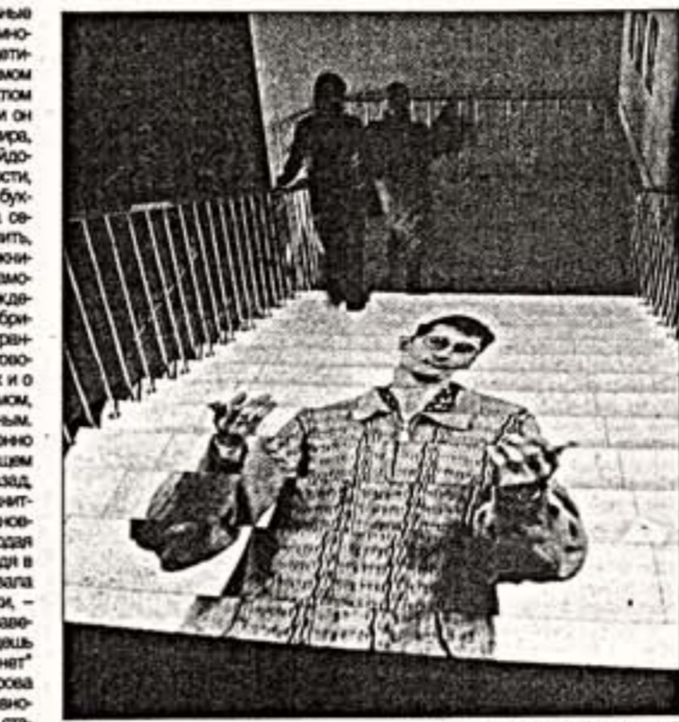
Ю. Васильев. "Отец наш". Видеопортрет после рыцаря и реалиста...