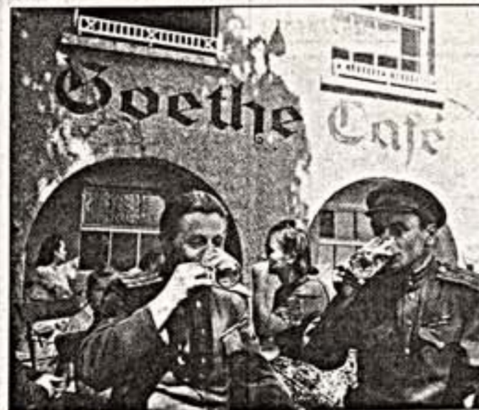
Войны-победители пробуют пиво. Германия, 1945 г. Значимые композиции. Эти кадры можно было бы приписать любому советскому автору...