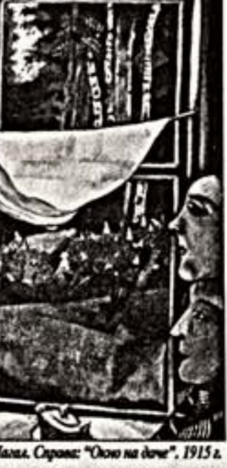
Семь М.Шагала. Серия: "Окно на дочь", 1915 г.