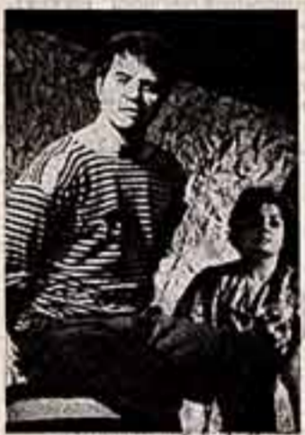
● Сцена из спектакля «Вечный огонь» Новороссийского народного театра.