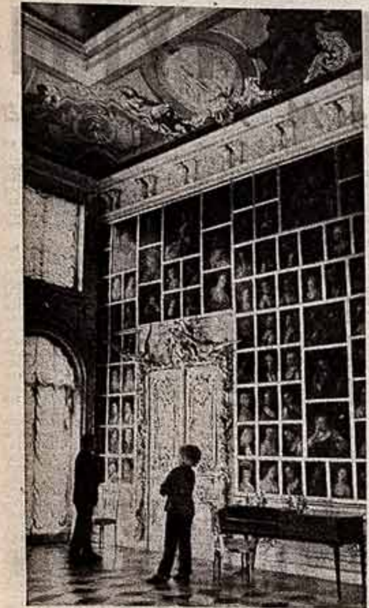
В обугленные развалины превратили фашисты знаменитый на весь мир Петродворец: более двух лет разрушалась и расхищалась сокровищница русской культуры. Сейчас дворцово-парковый ансамбль в основном восстановлен. Ожили сады, каскады, водоемы, поднялись из руин дворцы и павильоны. Но реставрационные работы еще продолжаются. ● В картинном зале Большого Петродворцового дворца.