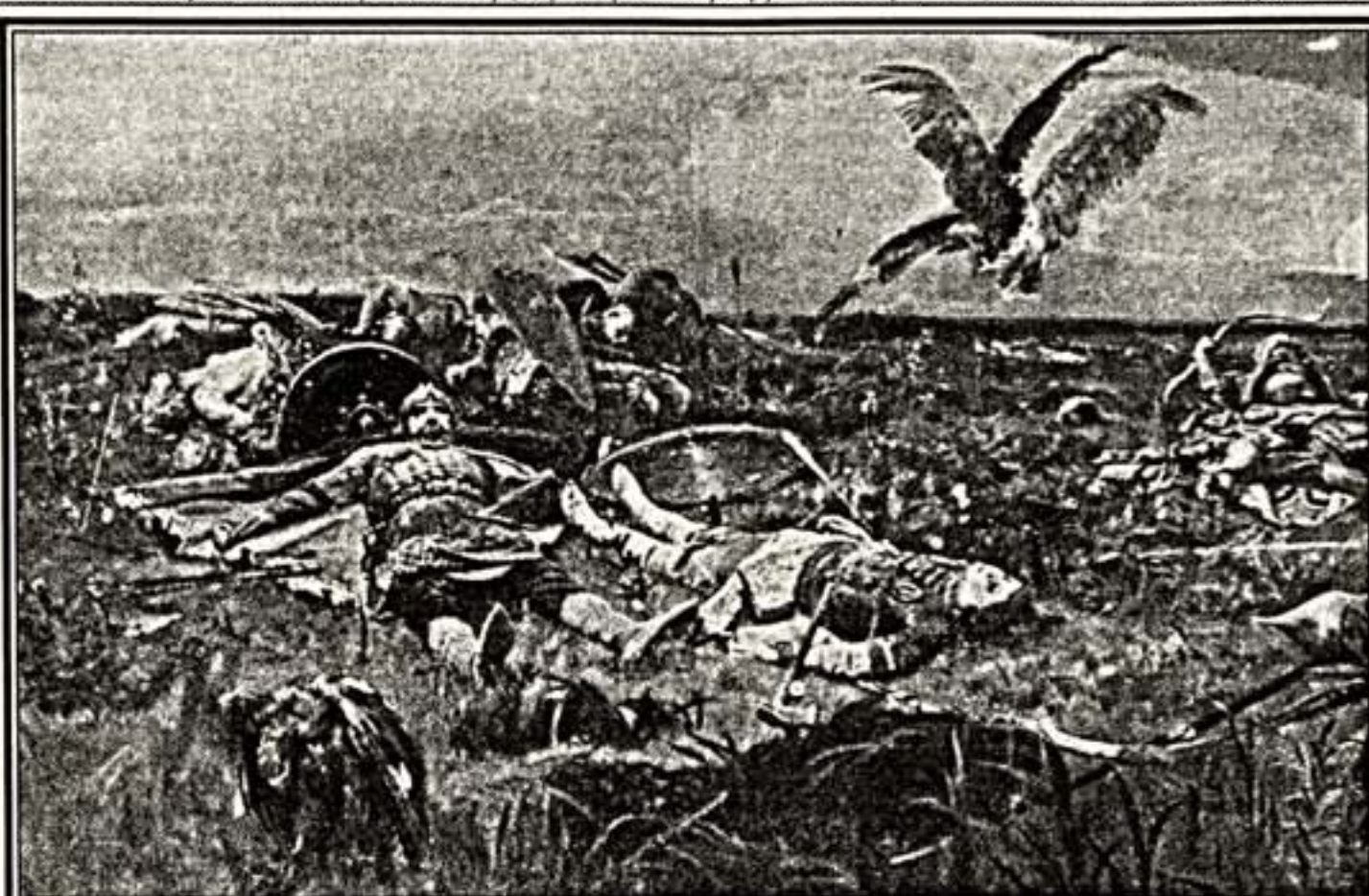
В.Васнецов. "После побоища Игоря Святославича с половцами". 1880 г.