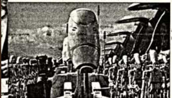
Кадр из фильма "Звездные войны. Эпизод I"