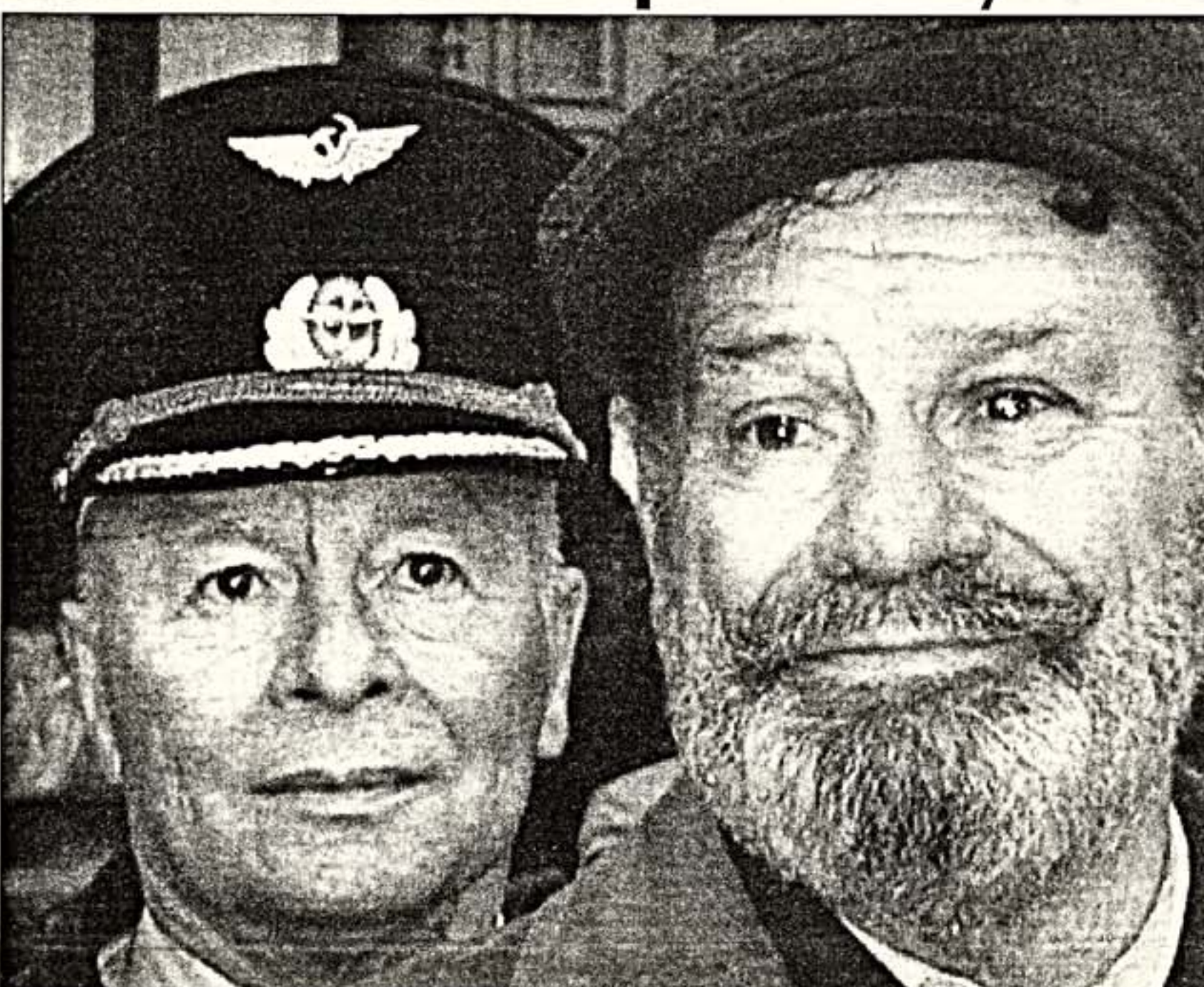
Фоторепортаж о последнем в XX веке Параде Победы — на 2-й стр.