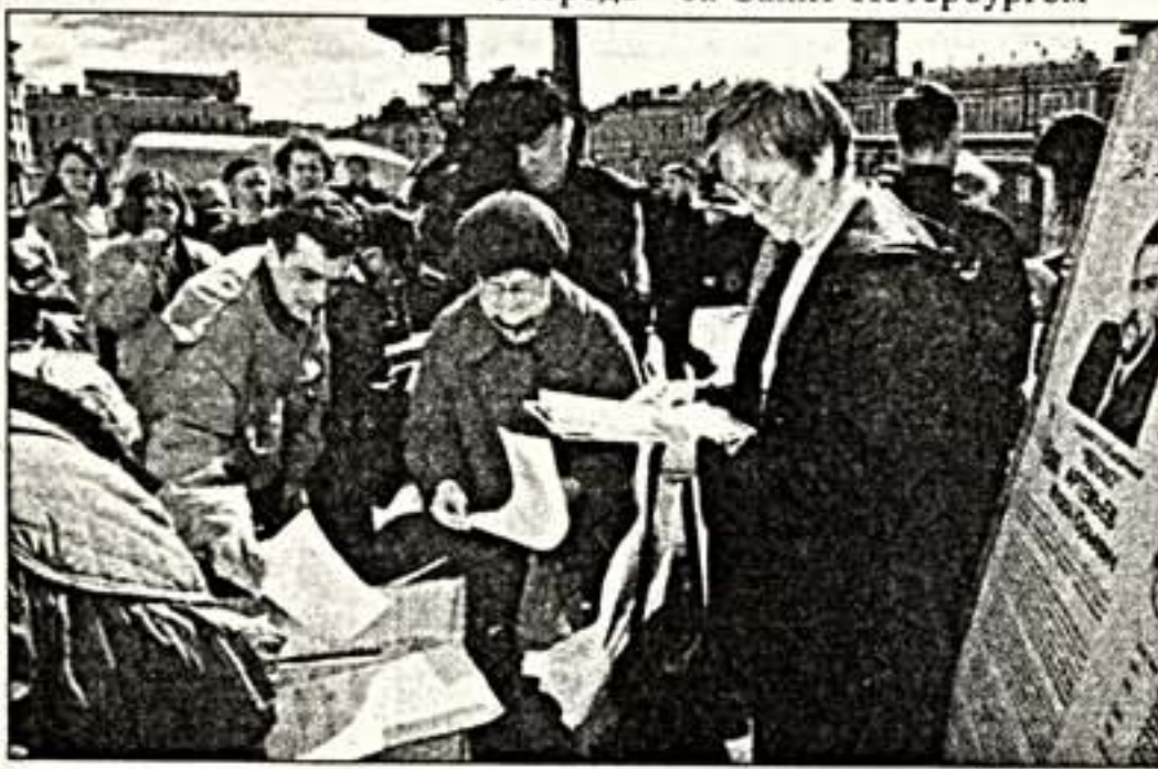
Идет голосование на площади Восстания

Выборы в Петербурге прогнаны демократами и, весьма вероятно, прогнаны в первом туре. До сих пор результаты политических выступлений СПС (в гораздо меньшей степени «Яблока») можно было считать или хотя бы представлять популярными - что позволило им остаться полуконституционной силой. И в выборах Сергея Кириенко на выборах московского мэра, и в результате досрочных выборов, и в исходе парламентского кризиса - можно было найти что-то общее в ситуации. Можно было обнаружить перспективу, отметить видимость успехов в СМИ, представить объединение демократов как шаг вперед и т.д. Сделать хорошую мину после грядущей свалки кандидата от правых с Яковлевым будет не сложно.