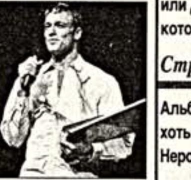
Начо Дуато, директор Национальной труппы танца (Мадрид)