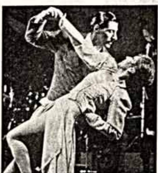
Шоу-спектакль "Tango Pasion" в исполнении танцоров из Аргентины.

Детский цирковой коллектив "Девичья" из Перми ждет приглашения на большие гастроли. Адрес: г. Пермь, в/п 3567. Телефоны: (3422) 65-45-02