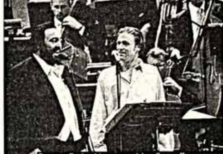
Россини и Паваротти

"Венецианское рондо" (семь дам и двое мужчин, одетых в костюмы эпохи барокко). Пятнадцать лет пользуется этот ансамбль большой популярностью как в кругу ценителей высокого искусства, так и в области "легкого жанра".