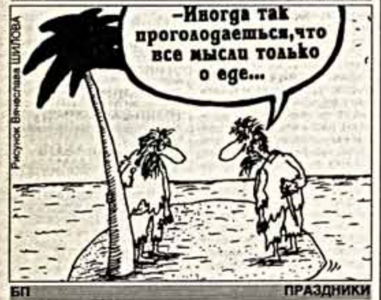
Рисунки Вячеслава ШИТОВА