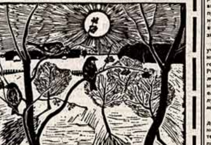
Словами расписные простели, обеты в хрусталь больше в ялме воды, и по всем просторам растелила белая холста. Когда расселась, увидела только два цвета — голубой снег и красные стелеры на рябиновых кустах.

От этого зима казалась жой северозападной землей становится еще краше и богаче. Я понадеялся показать ее людям в своих трагедиях.