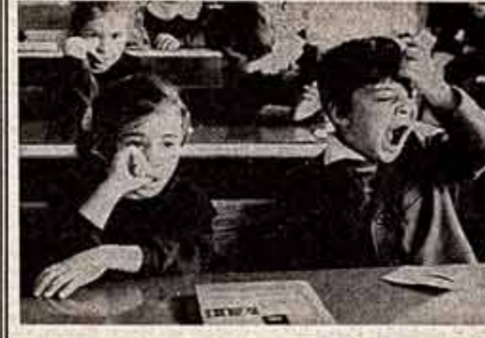
После фильма. А завтра воскресенье. Наша филармония.

Из чего складывается современный фоторепортаж? Из умения снимать и... В. СТИГНЕВ.