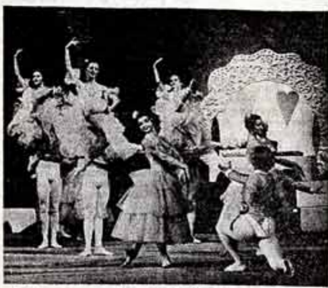
Новая постановка балета П. И. Чайковского «Щелкунчик» осуществлена на сцене Пражского национального театра.

Каждый человек доброй воли стремится всем сердцем к сохранению мира на земле. Наше страна, наш народ знают, что такое война не понаслышке, мы испытали это на себе.