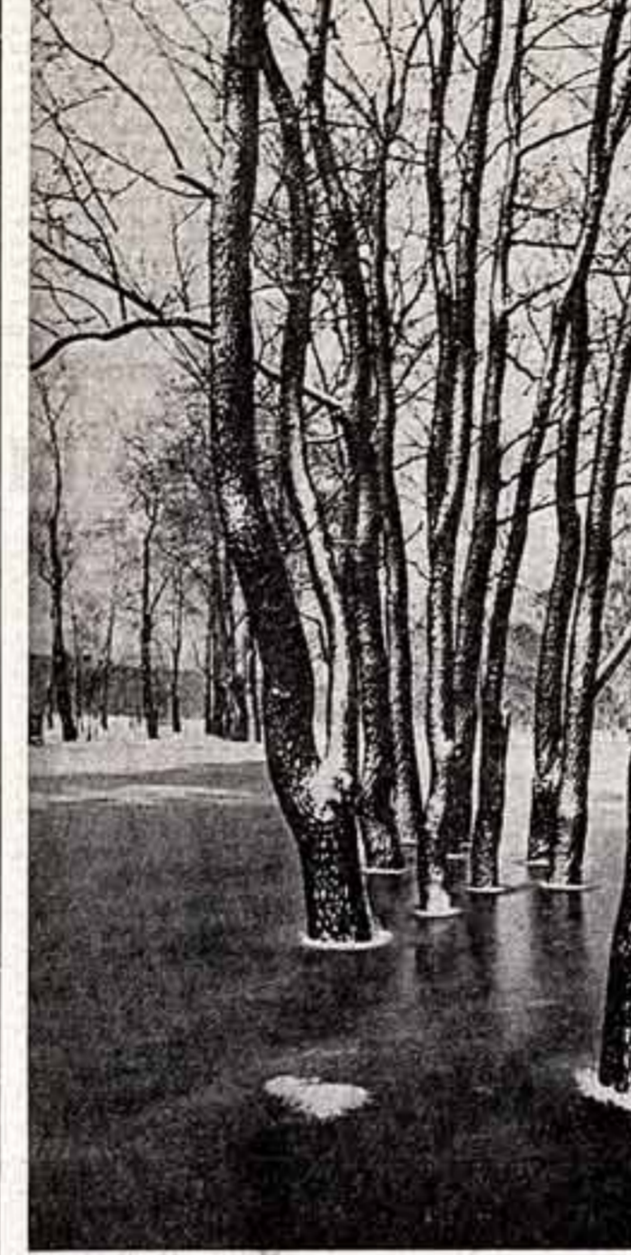
А. ЗЫБИН. «Весна наступает».