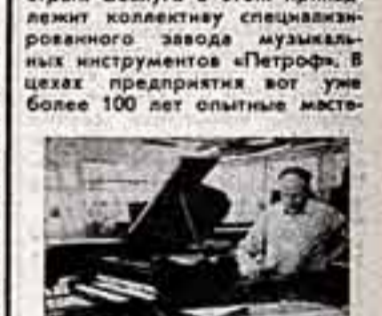
Полюбова Ллоши Герман из отделекой инструмента.

Восточно-чешский город Градец-Кралове широко популярен у музыкантов многих стран.