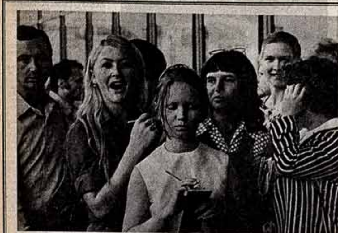
«ПАТРУЛЬ ВЫХОДИТ В РЕЙД» (СК», 5 февраля 1980 г.)