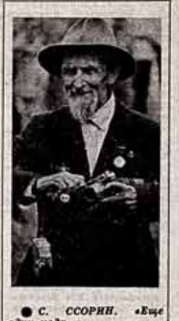
С. СОРОКИН. «Еще один кадр».

Муза фотографии не должна быть спророй в стране, где так любит фотографию, в стране, чей основатель придал ей государственное значение.