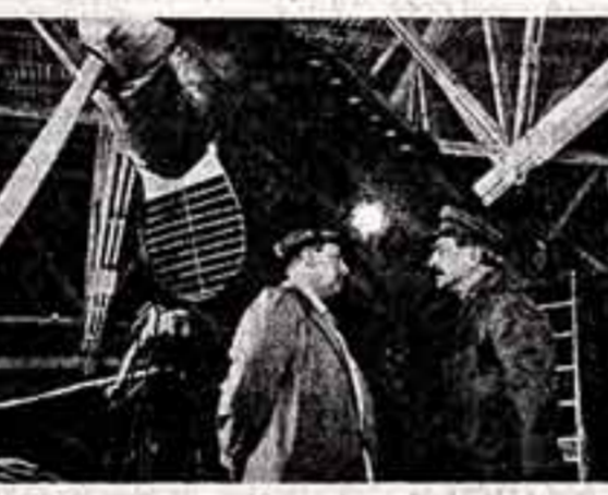
Кадр из фильма «Поэма о крыльях».