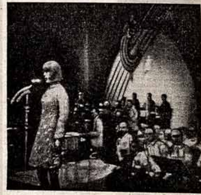
На Сочинском фестивале песни.