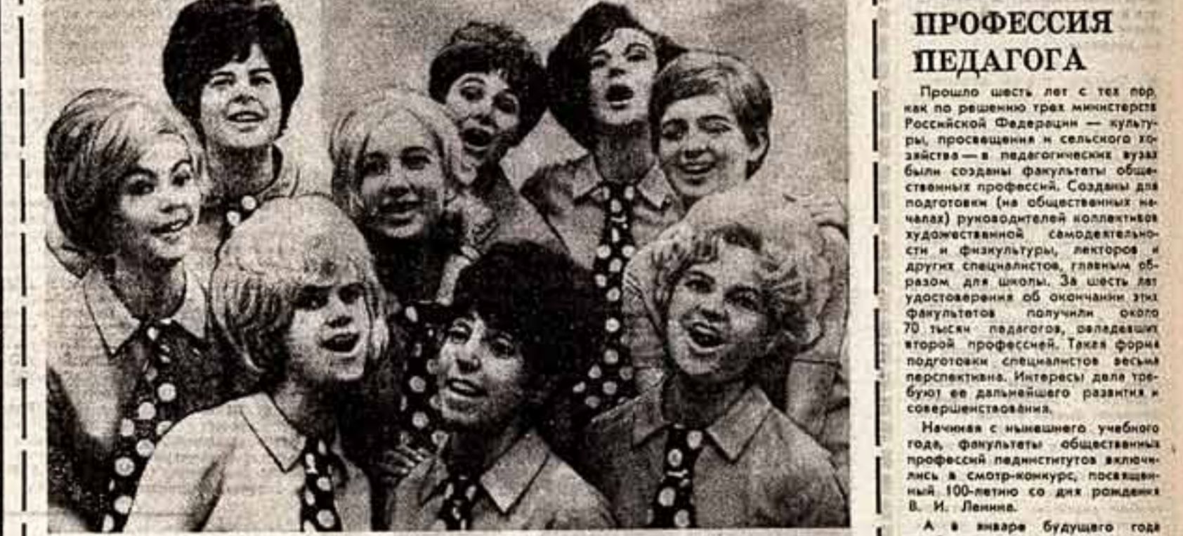
ЭСТОНИЯ. Фестиваль художественной самодеятельности эстрадного ансамбля «Каз» (Эстония) Таллинского дворца культуры молодежи...