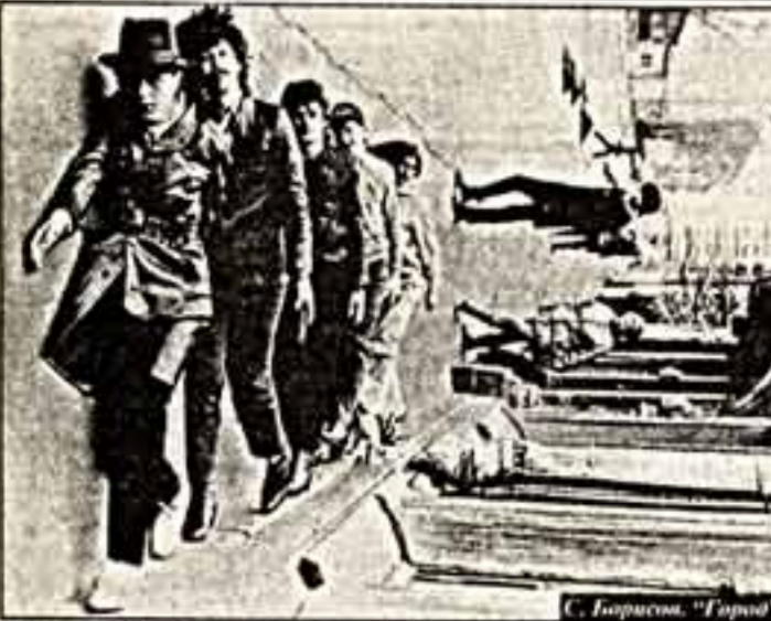
С. Горюнов. "Горный"