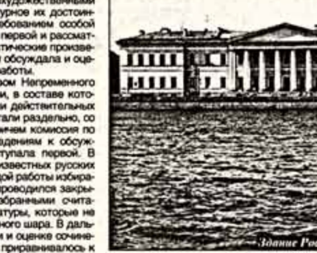
Издание Российской академии наук

своей личности. На домашнем совете наследники уредителя "решили продолжить выдачу премий", но уже по новым правилам. На счет академии ими был внесен капитал в сумме 75 000 рублей, проценты с которого стали служить премиальным фондом.