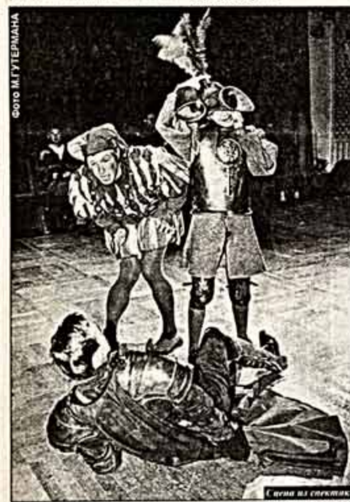
Сцена из спектакля "Жизнь есть сон".

К тому же весьма благородно, но наивно уповать на то, что в зале (даже таком небольшом) окажется слышно просвещенная публика, цитирующая Кальдерона наизусть. На деле же зрители очень долго и мушкетерно пытались понять, кто есть кто, и почему одни "страдают", а другие забавляются. Действие меж тем стремительно несло вперед, привлекая и приплясывая под стук каньонет, как-то уже само по себе, не оглядываясь на отставших зрителей. Если верить, жизнь — есть сон, то натуральные сновидения бывают куда более захватывающими.