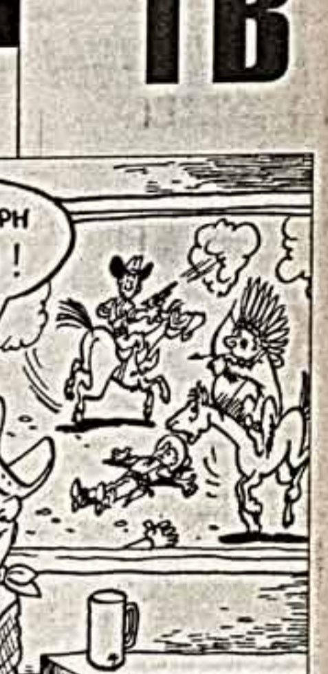
Рисунок А. ШАХГЕЛДЯНА