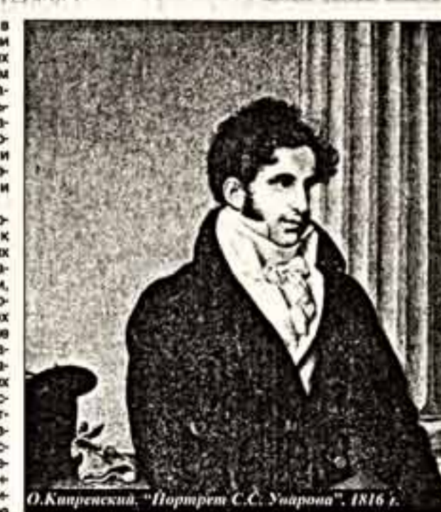
О.Кипренский. "Портрет С.С. Уварова". 1816 г.