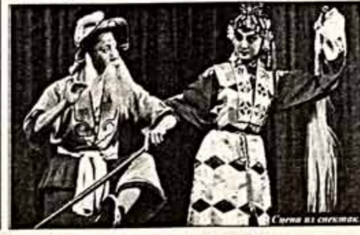
Сцена из спектакля "Осенняя река".

И только комедия "Черный бриллиант" можно было назвать вокальной оперой, хотя здесь в изобилии разглагольствования и пластические этюды. Говорит, партии в пекинской опере отличаются характерным разнообразием и мелодическим богатством, а вокальные шлол можно насчитать аж несколько. Как жаль, что европейскому уху во всех этих тонкостях с ходу ни за что не разобраться.