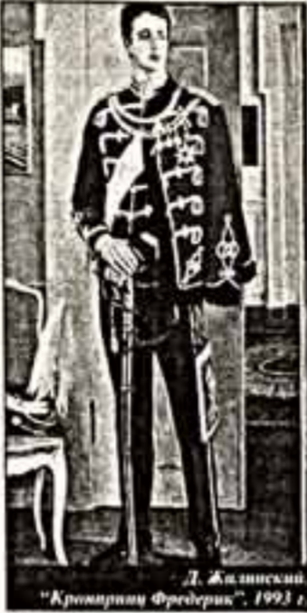
Д. Жилинских. "Кривошея Фредерик", 1993 г.