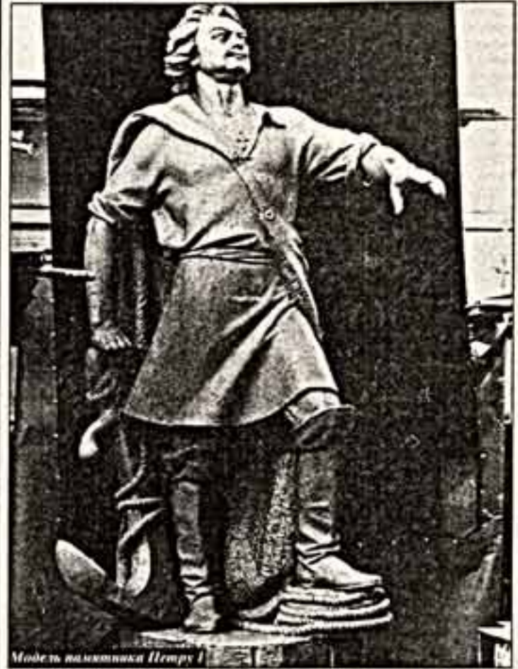
Модель памятника Петру

Первую свою работу Лев Кербель исполнил в 1935 году, приехал из родного Смоленска в Москву. Из Московского художественного института имени В.И. Сурикова в 1942 году добровольно ушел на фронт, служил на Северном флоте. Диплом защитил на "отлично" в 1948 году за скульптуры "Терни-североморцы" и "Трудный резерв". Хотя высокие профессиональные отличия мог бы получить за сочиненные во время войны бюсты своих друзей-подводников, моряков, летчиков, за монументальные ансамбли в память героев штурма Берлина, совет-