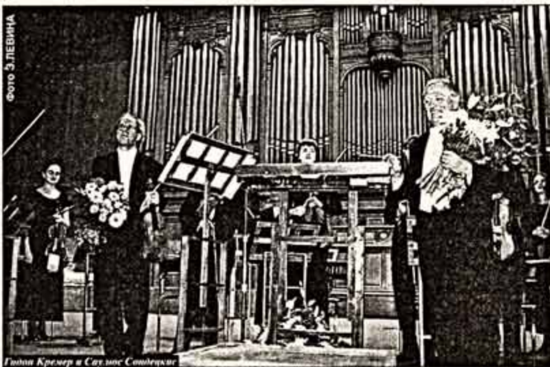
Гидон Кремер и Станислав Соловьев