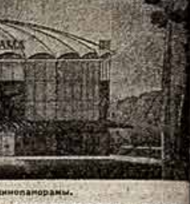
Проект разборного здания кинопанорамы.