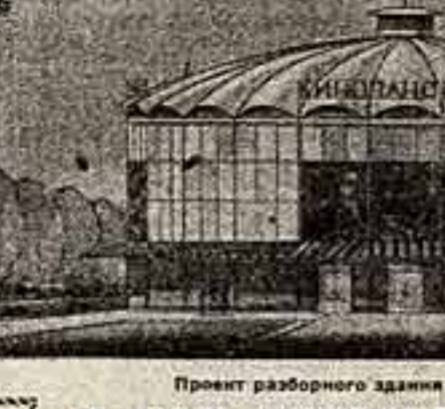
Проект разборного здания кинопанорамы.

Достоинство изобретения в том, что оно очень просто и в обращении, и в изготовлении. Любая школьница, пользуясь им, сможет через два месяца стать опытным шрифтовиком.