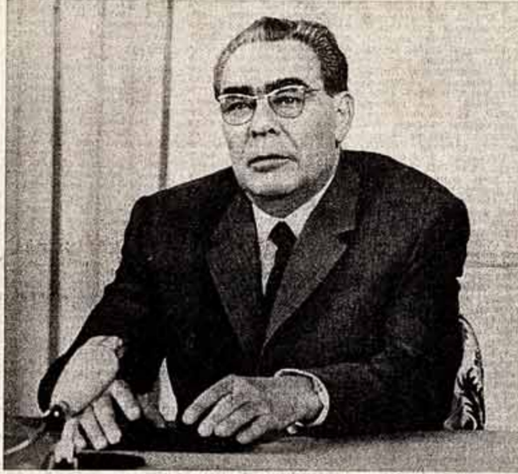
Л. И. Брежнев