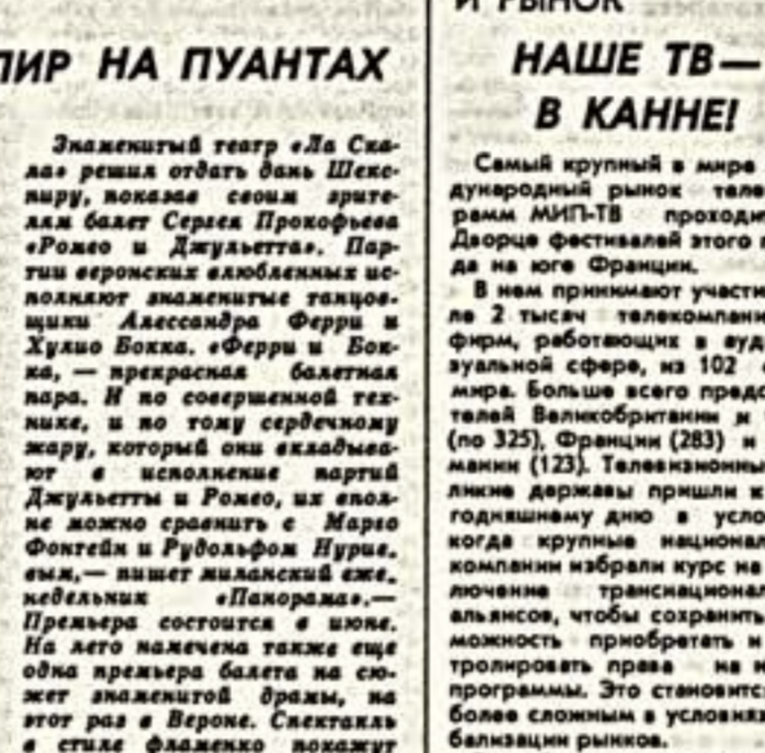
Знаменитый театр «Ла Скала» решил отбросить Шекспира, показав своим зрителям балет Сергея Прокофьева «Ромео и Джульетта».