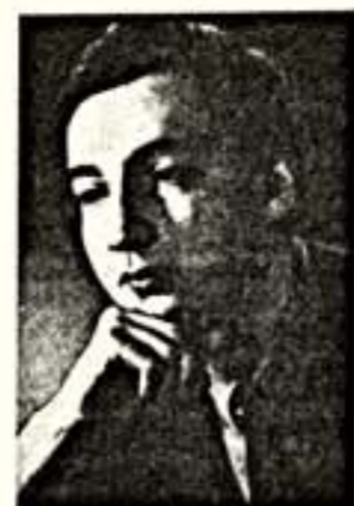
Только ведь голос, да еще хороший, дается далеко не каждому. И если человек хочет и может петь в опере, то почему бы ему и не петь?

Я спросила, любит ли он еще что-нибудь, кроме вокала. «Люблю все красивое, особенно красивых женщин, поэтому с удовольствием смотрю конкурсы красоты. А еще люблю смотреть футбол и читать газеты. В общем, человек как человек.