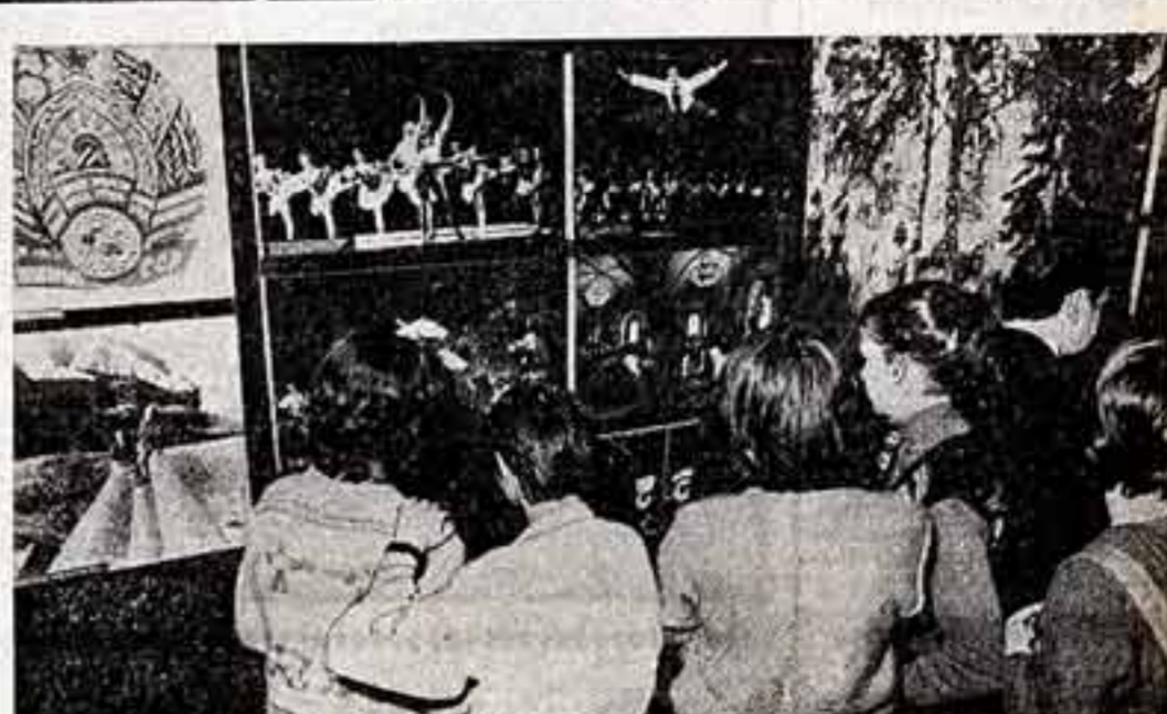
Фотоярмарка ТАСС «Мы — советский народ» открылась в Варшавском Доме польско-советской дружбы. Она посвящена 60-летию образования СССР и проводится в рамках мероприятий, приуроченных к юбилею. Открытие выставки стало значительным событием в культурной жизни польской столицы.

Строго и просто интерпретирует партию Чайковского дирижер Вессель-Терхорст. Он подчеркивает красоту музыки, избегает аффектации и ложной чувственности. Этим же благородной манере следуют исполнители. Особо хочется отметить мужскую часть труппы: Кари-Хайнц Оффенберг, прекрасный баритон, — сдержанно-аргоничный Онегин в первой половине спектакля и растерянный человек, потраченный бурей никогда прежде не испытанными чувствами, в финальных сценах. Крушныт в роли Михаила Грабов в роли Ленского — светлый, радостный юноша, созданный для