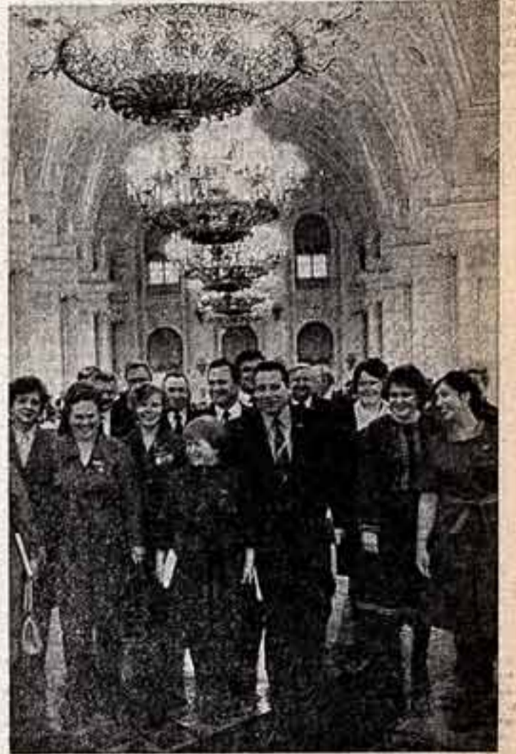
В Кремлевском Дворце съездов на совместном торжественном заседании ЦК КПСС, Верховного Совета СССР и Верховного Совета РСФСР, посвященном 60-летию образования Союза ССР.

Обращение «К парламентам, правительствам, политическим партиям и народам мира» единогласно принято на совместном торжественном заседании Центрального Комитета КПСС, Верховного Совета Союза ССР и Верховного Совета РСФСР 22 декабря 1982 года