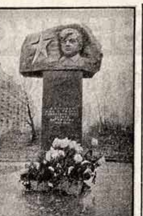
У станции столичного метрополитана «Автозаводская» воздвигнут мемориал, посвященный трудящимся Пролетарского района...