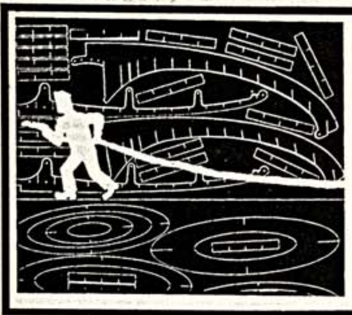
Художник Сергей Желто