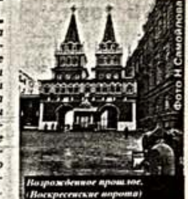
850-летия Москвы. Одним из самых знаменитых событий юбилейного года обещает стать грандиозный фестиваль "Творческой России - Москве".

Осенью 1997 года Москва встретит дни своего 850-летия не дежурными одами, не скорлупными стенами и плакатами, а обновленными площадями и улицами. На шпих - возродим шедевры старомосковской архитектуры, на других - совсем новые здания. Будут реставрированы лахташки Московского Кремля, театры, музеи, библиотеки, сады и скверы. Штрихи этого обновления проступают уже сегодня.