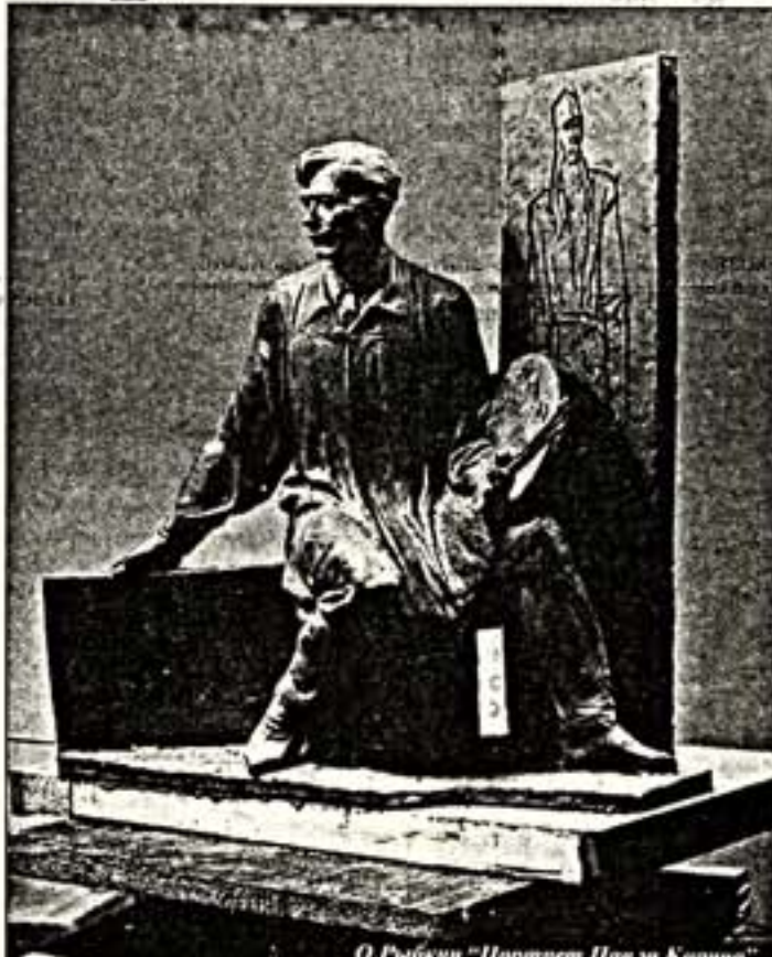
О.Рябкин "Портрет Павла Корина"