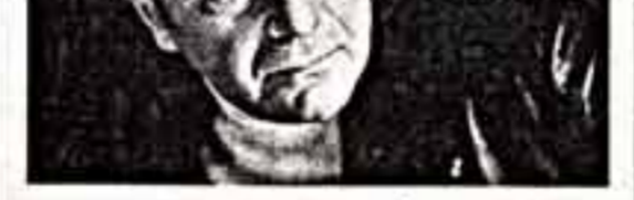
произошла, конъюнктурных соблазнов — всего того, чем были отмечены десятилетия послевоенные в застойные?..

Если драматургия была и остается труднейшим из родов литературы, то что сказать о трудностях драматургии в обстановке неслабого административно-редакторского