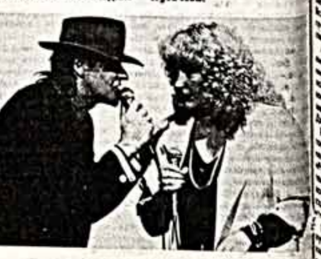
Удо Линденберг и Алла Пугачева.