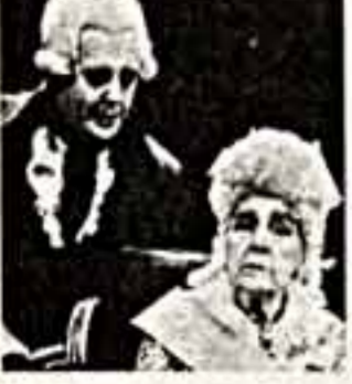
Сцена из спектакля.