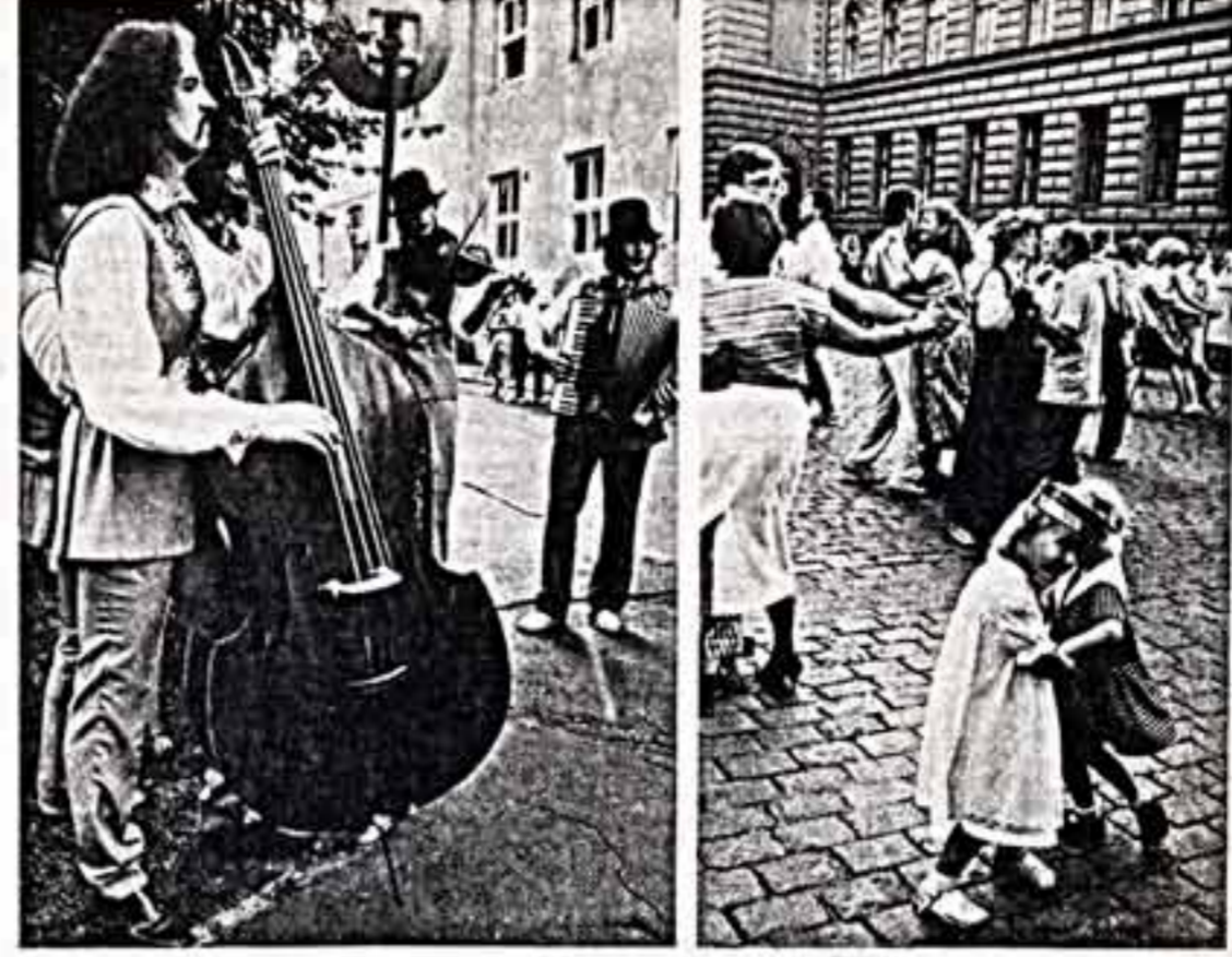
Впервые в Латвии состоялся традиционный международный фольклорный фестиваль «Валти-на-88». В Старой Риге, на других площадках латвийской столицы, в городах и селах республикан демонстрировали свое искусство этнографические хоры и танцевальные ансамбли из Болгарии, Польши, Финляндии, Норвегии, Швеции, Испании, ФРГ, США, а также из соседних братских республик — Литвы, Эстонии, Белоруссии.

Я уверен: наступит время, когда люди устанут от экстравагантности, воплей и ненатуральных придыханий со сцены.