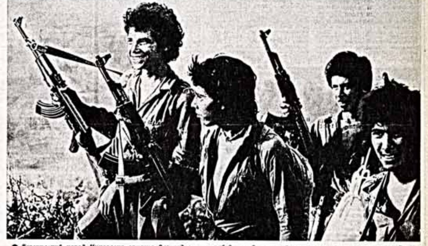
Героический народ Никарагуа отстоял 9-ю годовщину победы сандинистской революции. За это время главным достижением никарагуанцев стала победоносная оборона столицы революционными преобразованной перед лицом империалистической агрессии США и их пособников. В числе защитников революции — и эти юные бойцы сандинистской милиции.