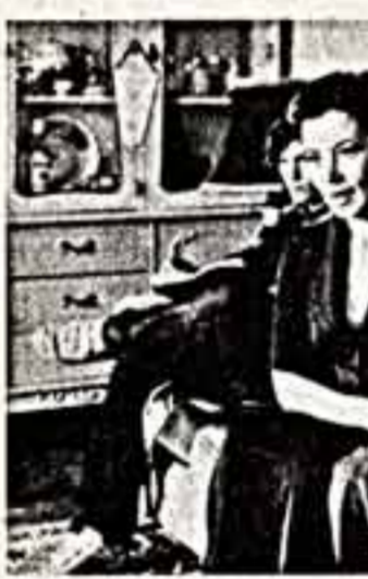
Кадр из фильма.