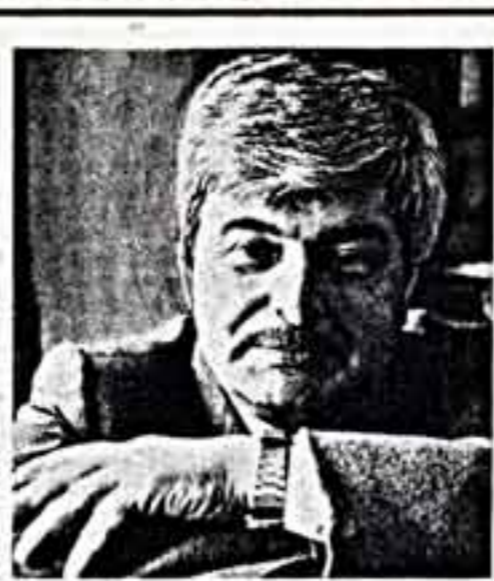
Гавриил Хартанович Попов, доктор экономических наук, профессор МГУ, специалист в области экономики социализма. Недавно стал главным редактором журнала «Вопросы экономики». Читателям известны его публицистические выступления в журналах «Знание — сила», «Наука и жизнь», «Знамя». Последний автор «Советской культуры». Его последняя публикация «Обратный ход не имеет» (7 апреля 1988 г.) получила большое число читательских откликов.

Если обещать, что бюрократизм можно изгнать, вырезать, то это шарлатанство, авантюризм, как сказали бы мы сегодня. Вырезать можно и нужно только крайности. А главный путь реальной борьбы — устранить то, что служит основой бюрократизма: слабый