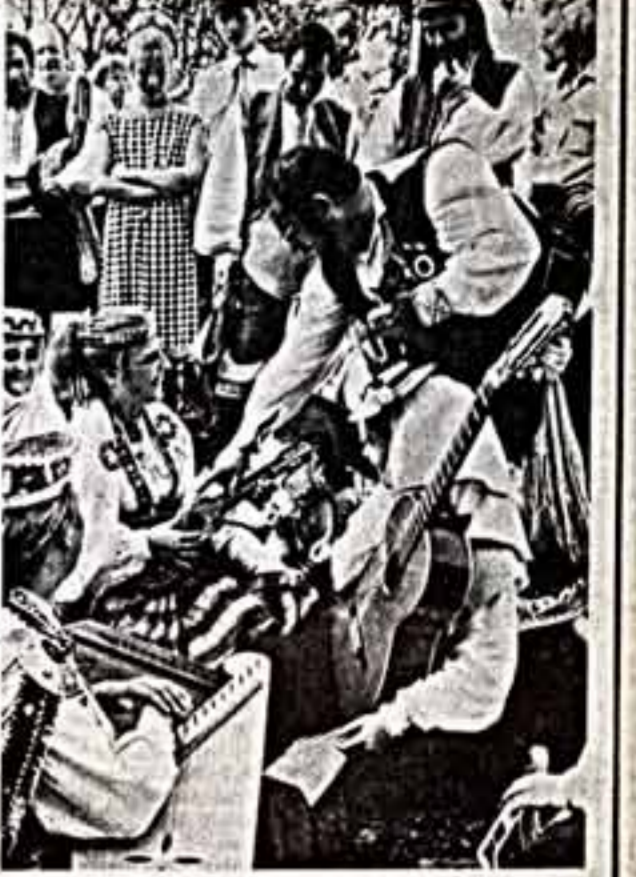
Выступает сельская капелла «Дандари» Английского дома культуры. Танцуют все. Настраивают инструменты.