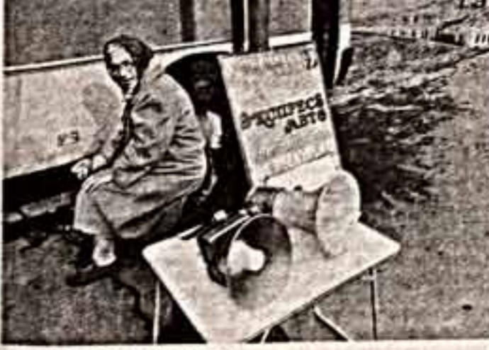
В облике журналиста.