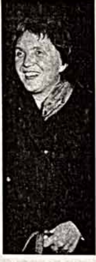
Изабелла Цивиньска, министр культуры и искусства ПНР:

Новый премьер-министр Польской Народной Республики Тадеуш Мазовиц назвал Изабеллу Цивиньскую по телефону в Омск, куда она приехала стать молдеромского Тартофа в академическом театре драмы. Этот визит не зря отнесен к числу обычных, ибо театральную режиссеру Изабелле Цивиньской было предложено возглавить министерство культуры и искусства Польши. Женщина-режиссер — явление само по себе не частое, ибо для этого требуется сильный характер и заражающая теоретическая воля. Женщины-министры-подобные прецеденты в мире можно сосчитать по пальцам. И так, познано, что Изабелла Цивиньская дважды разрушила привычный стереотип женской судьбы. Она мечтала стать режиссером еще тогда, когда училась в Варшавском университете. И, окончив его, трижды сделала поступательные шаги к Высшей режиссерской школе. Полезу трижды! Да потому, что будущей ее наставник выдающийся польский театральныи деятель Богдан Коженевский считал, что женщинам в режиссуру делать нечего. На третий раз он все-таки признал право Изабеллы на амьскую про-