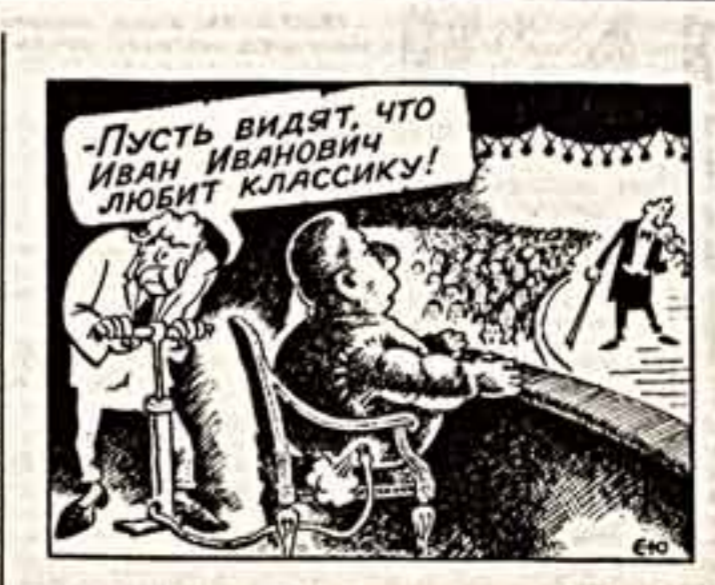
Рисунок Ю. Самарина.