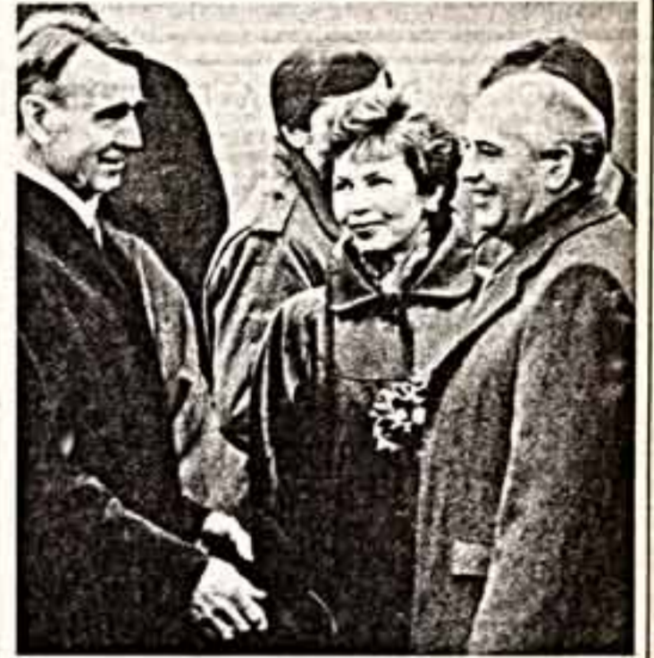
Встречи на земле гостеприимной Финляндии.

«Норвежская сторона с удовлетворением констатирует выраженные в речи советского лидера позитивное