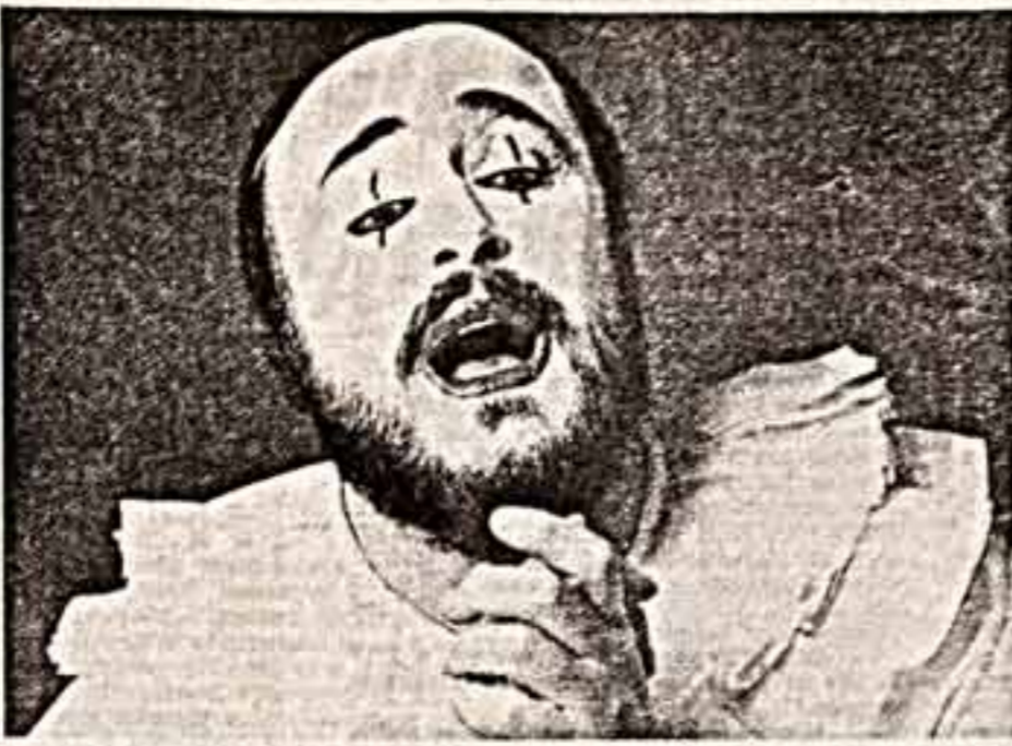
«ЗВЕЗДЫ» МИРОВОЙ ОПЕРЫ