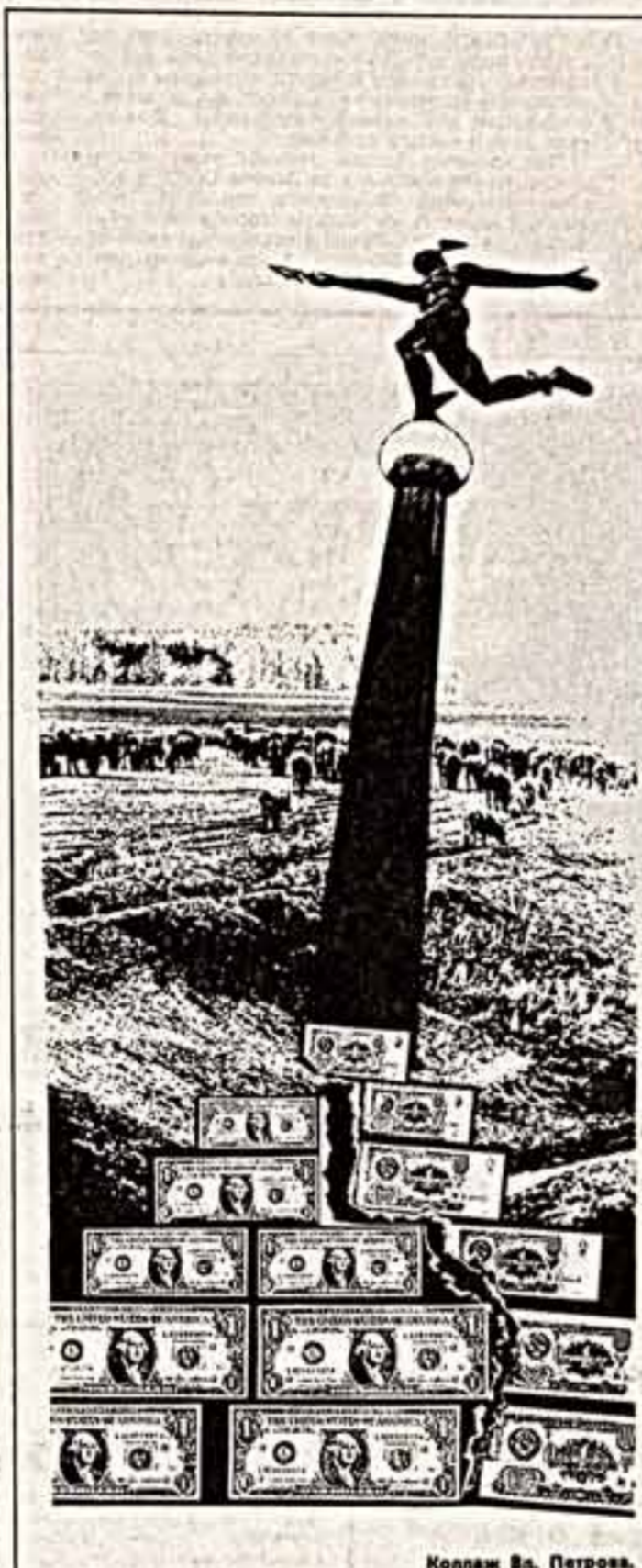
Коллаж В. Петрова.

Когда мы были экспортеры (я тоже участник тех легендарных дел), то проверяли, как, что, какой качества, как хранит в перевозке «фермер». Была Общественная экспортная комиссия, в которой мы задавали тон, и результаты утвержденных итогов комиссии доводились до мирового рынка. А то, что говорят авторы беседы, — перекармливание с большой головы на здоровую.