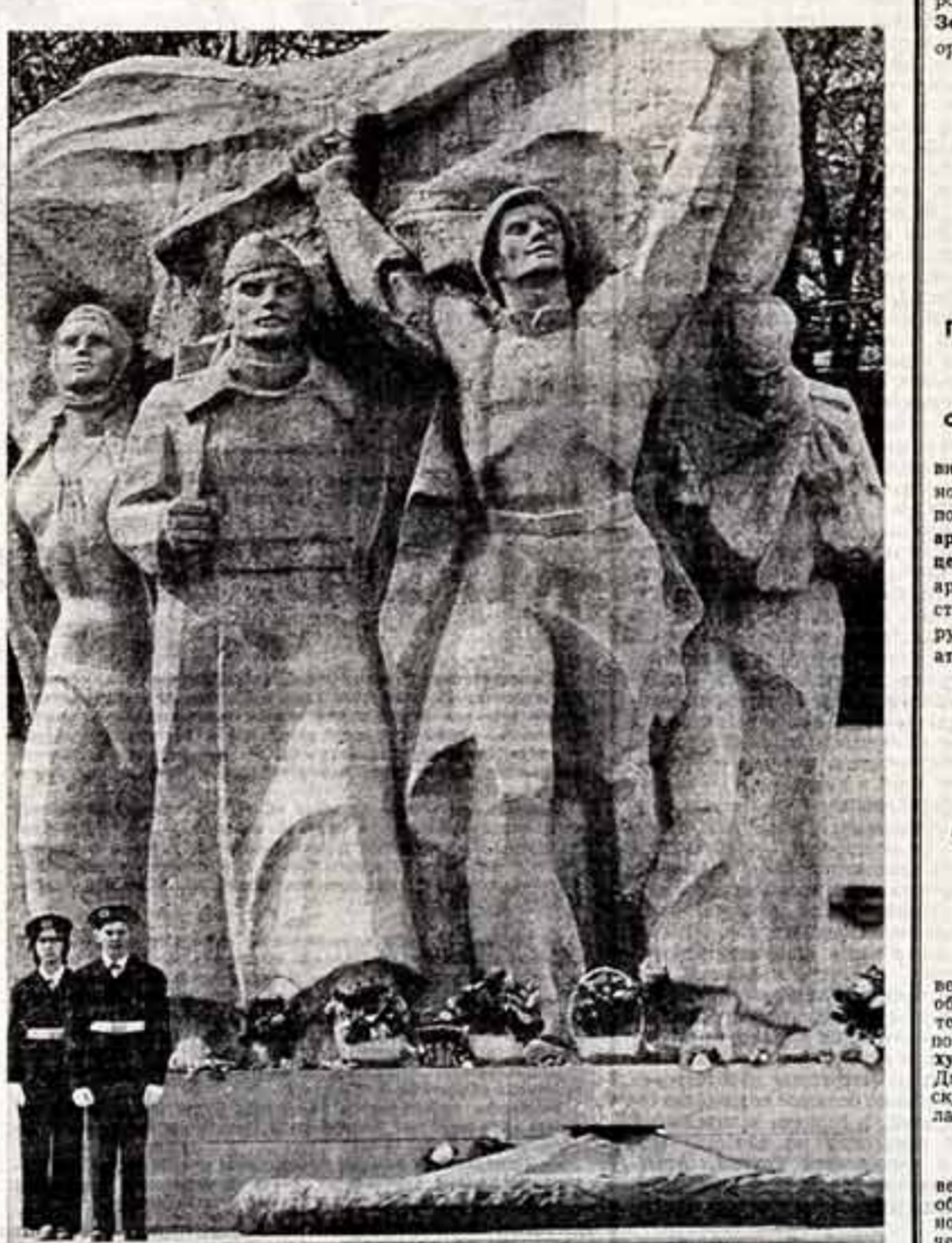
Родина помнит своих героев. Слагает о них песни, стоит им памятники. Стоят в почетном карауле пионеры Рязни у памятника воинам-освободителям.