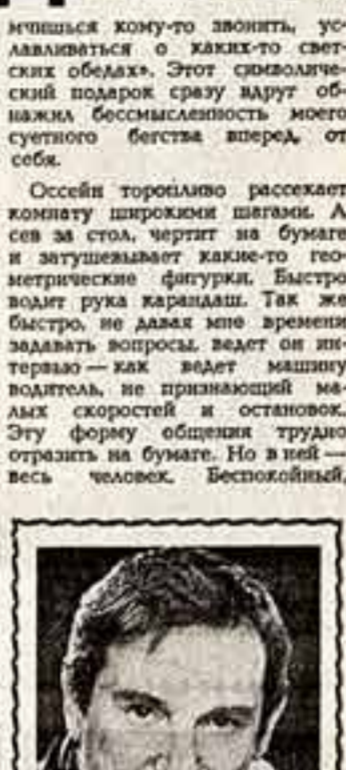
На французской театральной сцене Робер Оссейн занимает особое место. Его грандиозные спектакли-эссе «Броненосец», «Дантон» и «Робеспьер» привнес в театр создателя нового монументального «массового театра». Воспринимая лучшие традиции народных представлений, обращаясь к самой широкой аудитории, он завоевывает успехом. Известен Оссейн и как актер и режиссер кино. Советский зритель хорошо помнит его по фильмам «Ангелика — маркиза ангелов», «Снохо он увидит его в «Профессионала» (вместе с Ж.-П. Бельмондо). В прошлом году вышла его экранизация пьесы «Адвокат», в которой он сам участвовал в качестве актера и режиссера.

мчаться кому-то звонить, улавливать о каких-то светских обедах». Этот символический подарок сразу сразу обманчиво бессмысленности моего суетного бегства вперед, от себя. Оссейн торопливо распахнул конуру широких шагал. А сев за стол, чертит на бумаге и загущивает какие-то геометрические фигуры. Быстро водит рука карандаш. Так же быстро, не давая мне времени задавать вопросы, ведет он итервал — как валет мизантропа, не признающий малых скоростей и остановок. Эту форму общения трудно отразить на бумаге. Но в ней — весь человек. Беспокойный,