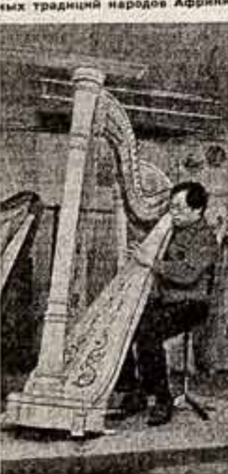
Музыкальные инструменты, изготовленные на заводе «Аомага гакки» в городе Фукуи, известны далеко за пределами Японии. Считают, что изделия мастера известны как таим дерева, которые делают звучание инструмента особенно богатым.