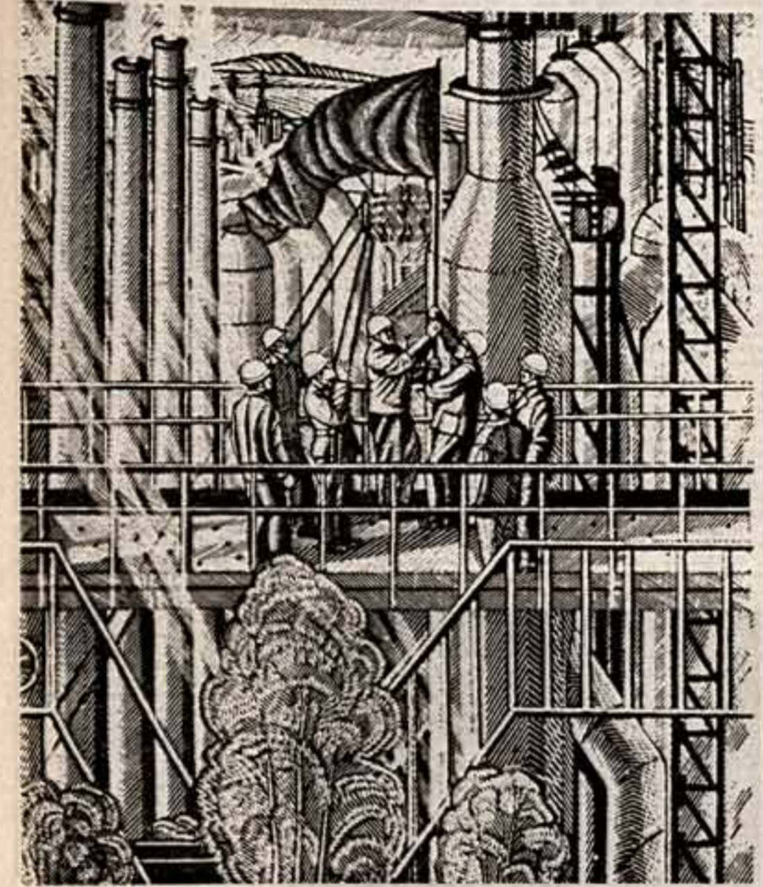
В Воронеже состоялась выставка работ заслуженного художника РСФСР М. Ахунова. В экспозиции представлены живописные полотна, созданные автором за последние годы. После поездки в нашу страну и в зарубежные страны художник выложил около тысячи замечательных исторических живописей, сделанных с любовью и тщательностью В. И. Лениным.

● Киномеханик В. Гришин.