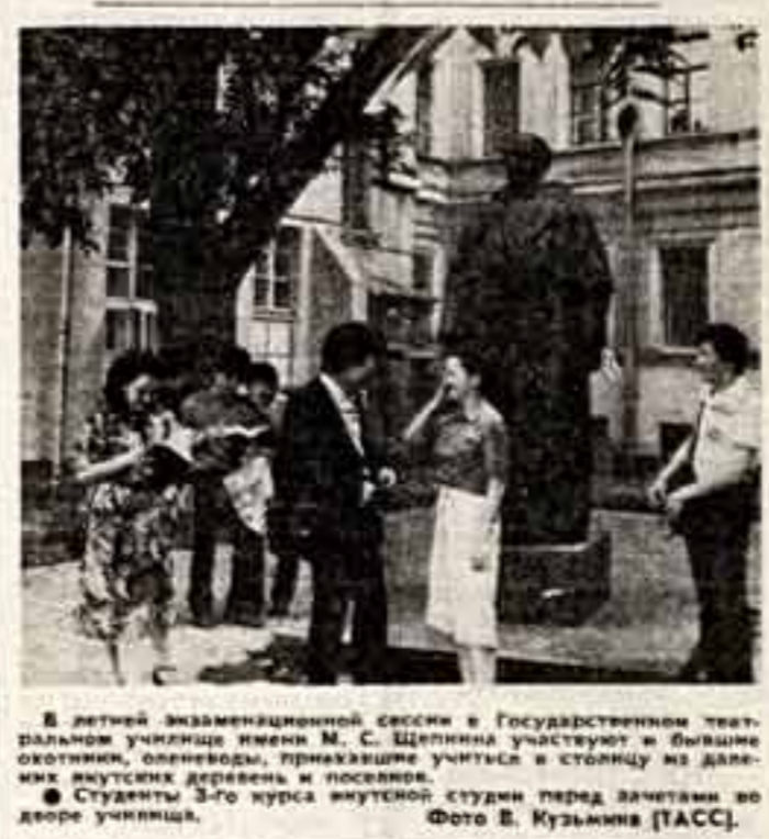
В детской эстрадной студии в Государственном театральном училище имени М. С. Щепкина участвуют в фильме охотники, оленоводы, приехавшие учиться в столицу из дальних уголков республики и поселков. Студенты 3-го курса музыкальной студии перед зрителем во дворе училища.