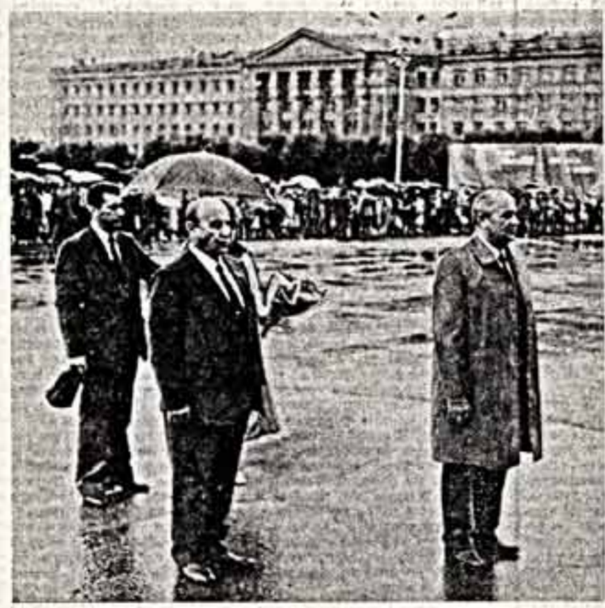
Во время возложения цветов к памятнику В. И. Ленину на центральной площади Хабаровска.

М. С. Горбачев: Это не годится. Я перед всеми говорю: это мы осуждаем. И надо, чтобы об этом и в газетах в полный голос писали. Вот говорили мы здесь с редак-