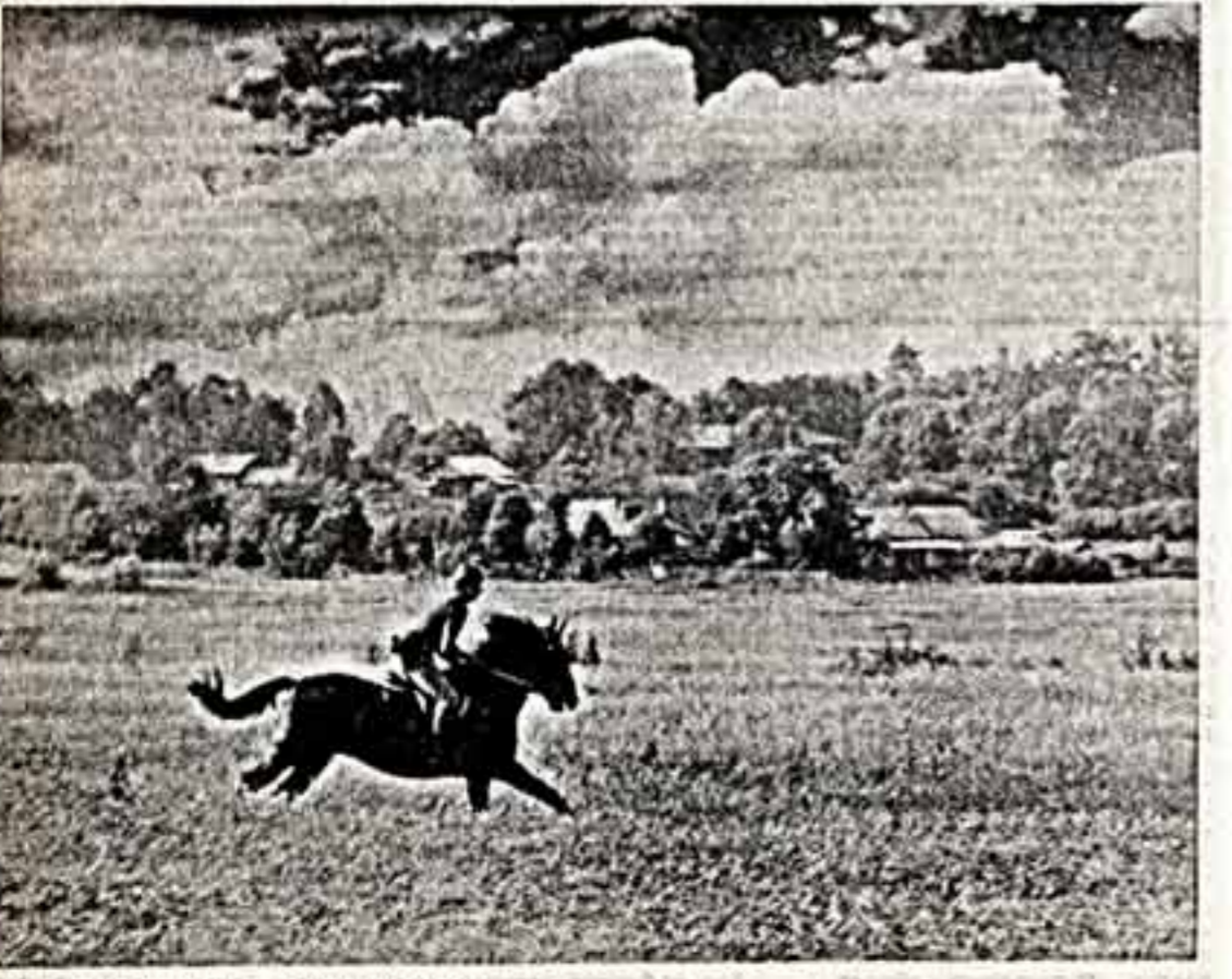
П. МАКСИМОВ. «Какой восторг».

Деревня Иконниково, пропустив посередине бойкую дорогу, двумя посадами сбегает по угору к речке Пошке.