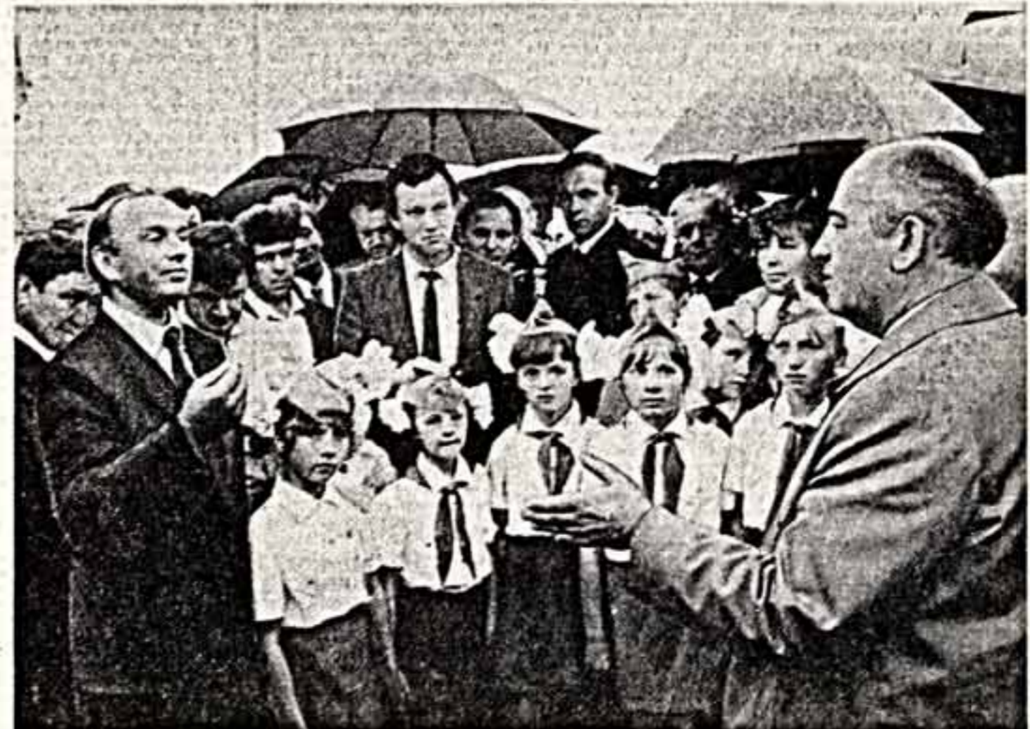
Во время посещения совхоза «Краснореченский».