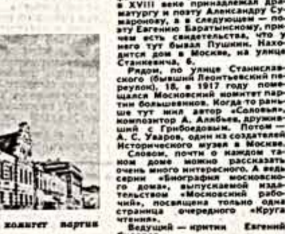
Ул. Станиславского. Московский комитет партии большевиков.