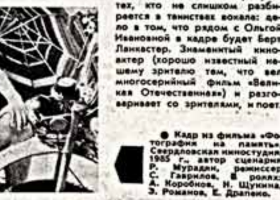
Кадр из фильма «Облака на память».