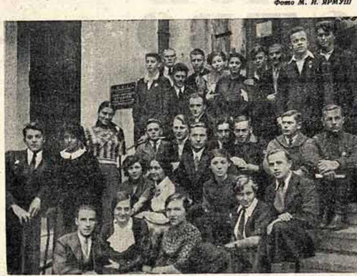
Группа студийцев, принятых на первый курс драматического отделения Студии К. С. Станиславского

По постановлению ЦК партии и Совнаркома 10 сентября в магазинах поступили в свободную продажу школьные учебники...»