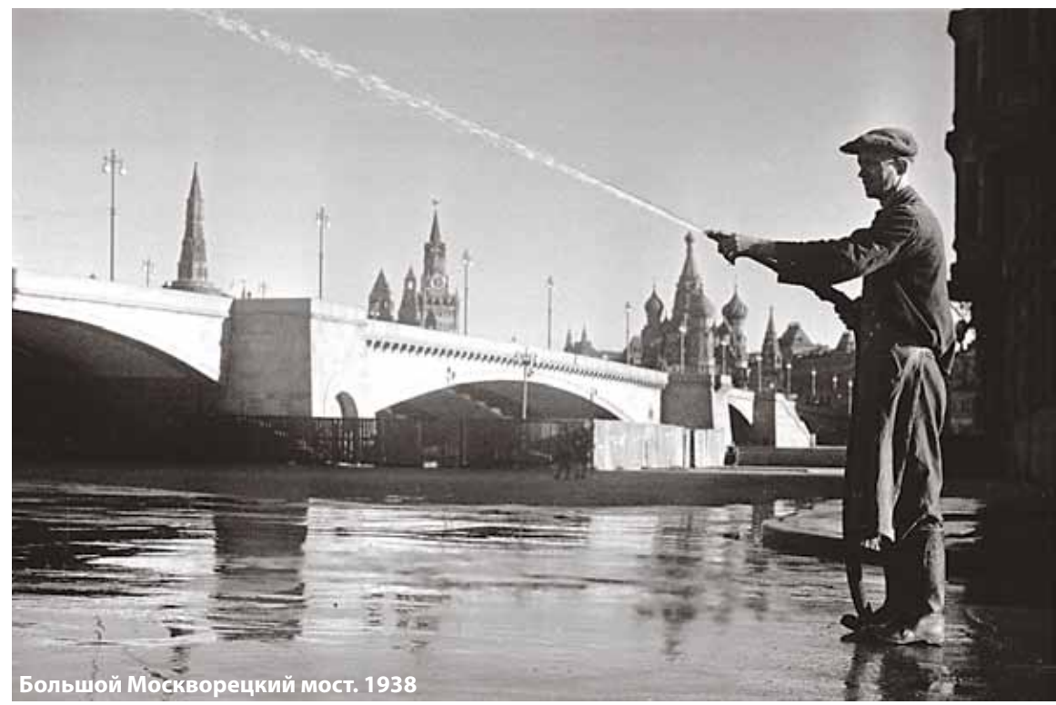
Большой Москворецкий мост. 1938

Кстати, Сталин был противником сверхвысотной массовой застройки Москвы. По многим причинам. Начиная от экологической, ведь с ростом этажности уменьшается количество зелени на человека в городе. И заканчивая проблемой безопасности: если горит высотка, жертв всегда намного больше, чем в малоэтажном здании. План впервые в России — СССР предусматривал максимальное удобство размещения магазинов и учреждений быта — как сейчас бы сказали, в шаговой доступности.