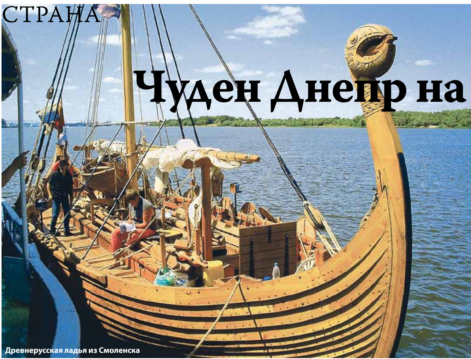
Древнерусская ладья из Смоленска