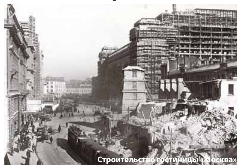
Строительство гостиницы «Москва»

Изменения были грандиозными. Благодаря им люди в буквальном смысле в считанные годы оказались в будущем: среди широких проспектов и бульваров, освещенных электрическими фонарями, грандиозных набережных и парков, ультрасовременной по тем временам системы общественного транспорта. Коммуникаций, горячей воды и центрального отопления, бытового обслуживания, новейшей системы общественного питания и организации досуга.