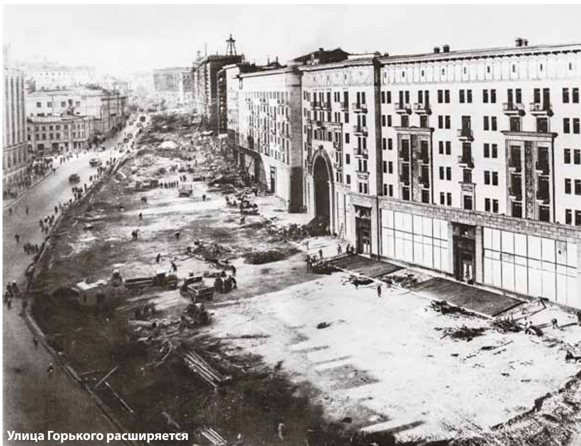
Улица Горького расширяется

После революции градостроительные проблемы лишь усугубились — в столицу ринулись жители деревень и провинциальных городов. Остро встал вопрос жилищной, транспортной, коммунальных и бытовых услуг,