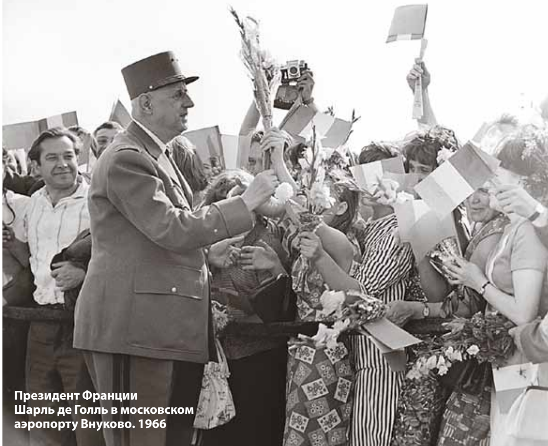
Президент Франции Шарль де Голль в московском аэропорту Внуково. 1966