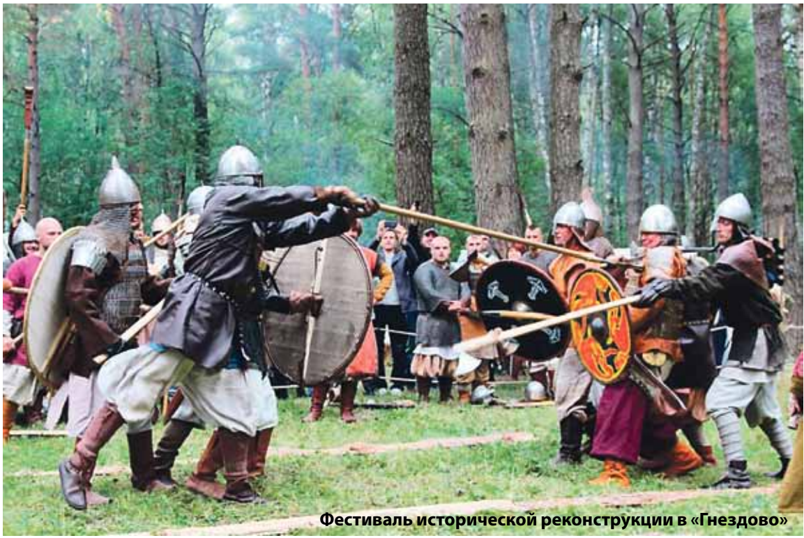
Фестиваль исторической реконструкции в «Гнездо»