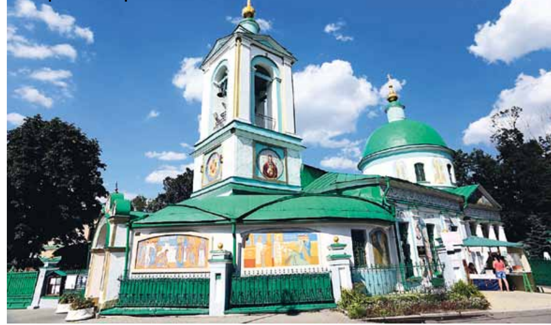
Храм Живоначальной Троицы на Воробьевых горах

культура: Однако в 2009 году президент Никола Саркози вернул Францию в военную организацию НАТО. де Голль: Саркози совершил глупость — хотел доставить удо-