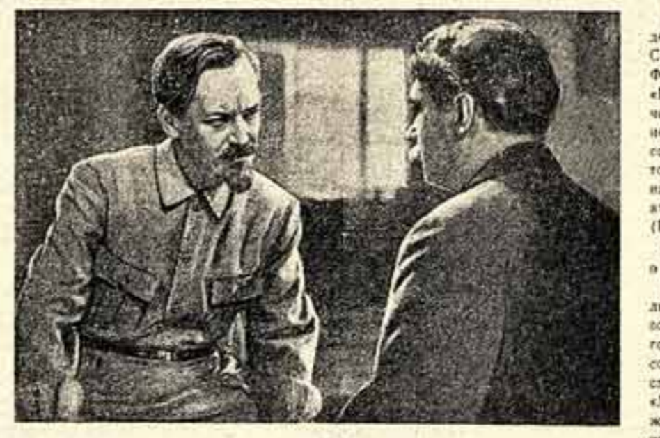
«Юноше, обдумывающему, скажу не задумываясь: — Делай же житье, с товарища Дзержинского. — Сделать бы жизнь с кого, в. МАЯКОВСКИЙ.»

АРХАНГЕЛЬСК. Здесь начинается строительство нового кинотеатра. Помимо двух залов на 350 мест каждый, запроектированы фойе с эстрадой для концертных выступлений, читальный зал, буфет-ресторан. Строительство кинотеатра намечено завершить в первом полугодии 1953 года.