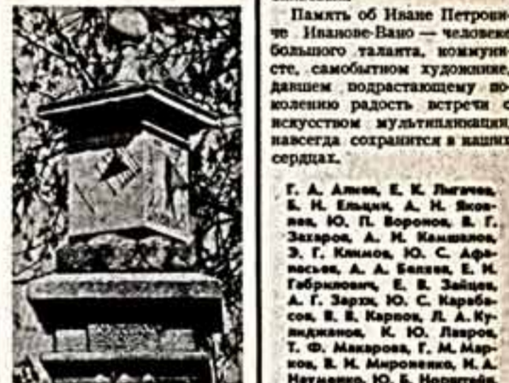
Село Мраморское. Сельские часы 1773 года.

С. БОГОМОЛОВ. МРАМОРСКОЕ. Свердловская область.