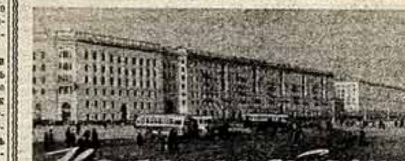
На земле сталинградской

Председатель Президиума Верховного Совета СССР К. ВОРОШИЛОВ. Секретарь Президиума Верховного Совета СССР М. ГЕОРГАДЗЕ. Москва, Кремль, 15 января 1958 г.