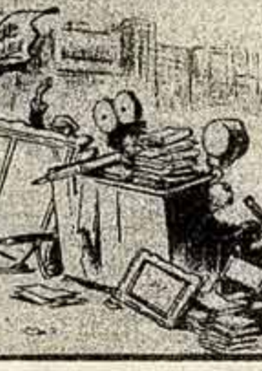
Разгромленный фронт. Художник Ми Гу. Сентябрь 1937 г.

Ник. КРИВЕНКО, спец. корр. «Советской культуры».