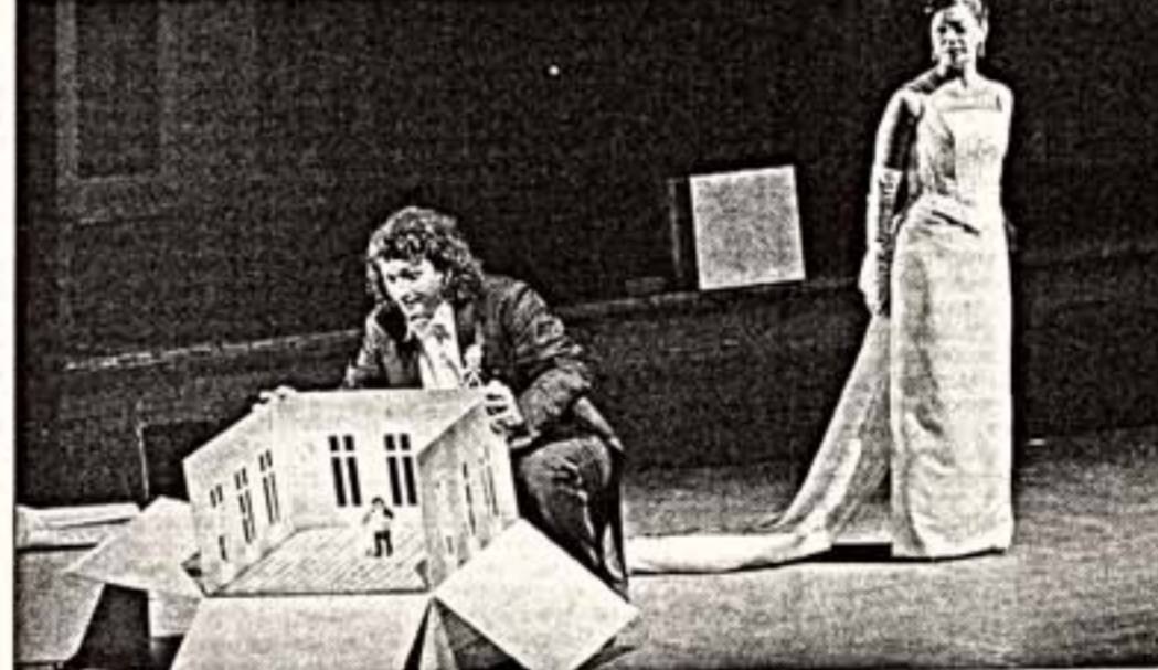
Сцена из спектакля "Похитение из серала"

Оперная программа Зальцбургского фестиваля