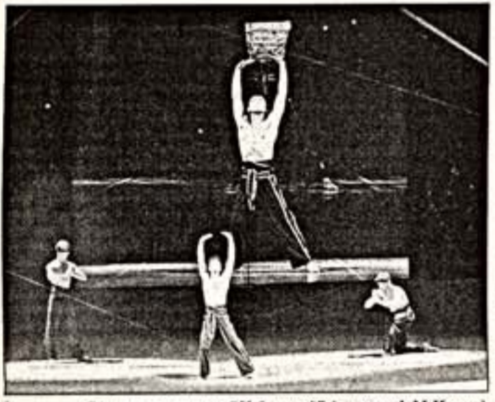
Сцена из спектакля "Избранный" (хореограф М. Наума)

Поводом для концерта в Большом театре стало 30-летие фильма Александра Митты