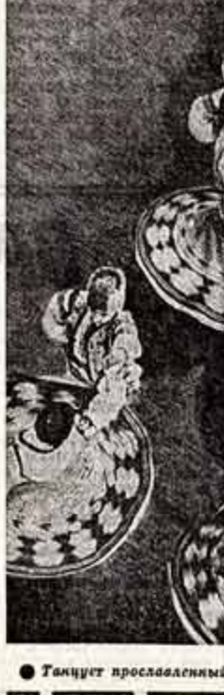
● Танцует прославленный «Жюк».

Молдавия превзошла по многим показателям экономического, научного, культурного строительства «самых развитых капиталистических стран Европы».