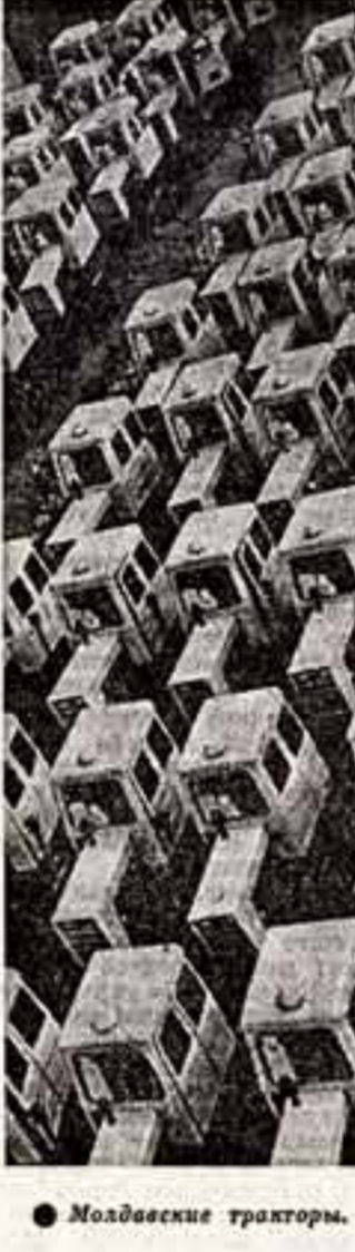
● Молдавские тракторы.

И далеко тоску мою, Шума, усны волн... Перевод М. Голодного.