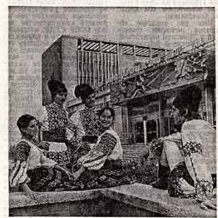
● Участники самодеятельного танцевального ансамбля республиканского молодежного центра имени первого космонавта Ю. А. Гагарина.