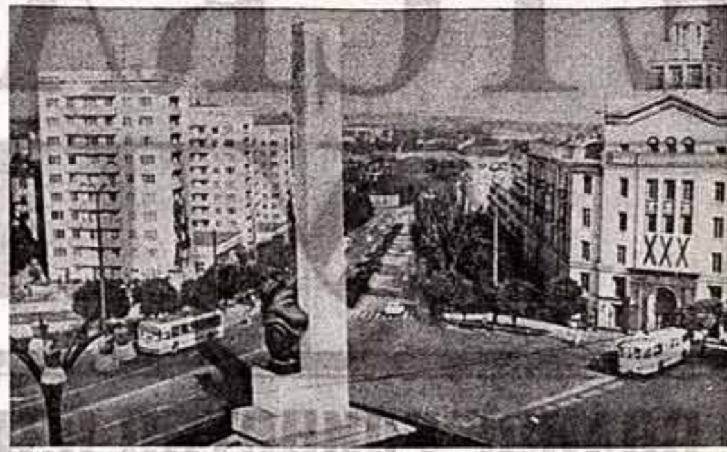
● Столица Молдавии — Кишинев. Бульвар Петруца.

Более 60 тысяч человек объединяют клубы инкоопбатель. К 50-летию республики и ее Коммунистической партии завершили съемку 40 документальных, научно-популярных и видовых фильмов.