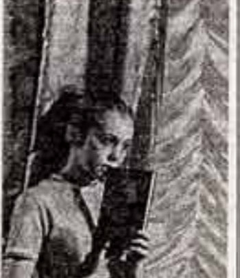
На снимках фрагменты из телевизионного фильма «Утро в Москве».