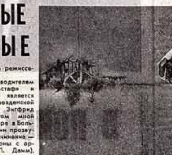
Сцена из спектакля «Мальчик Левина».

Двадцатилетие провозглашения Германской Демократической Республики отмечается в Ленинграде праздничными мероприятиями Дней Дрездена — традиционного праздника интернациональной дружбы городов-побратимов.