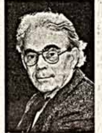
Понятия идеологии, гражданственности, школы жизни применительно к театру уже не только не в фаворе, а сознательно вытесняются. Ради чего? Ведь театр — это отражение жизни. И люди, не до конца, может быть, понимая это и желая у нас просто развлечения, уйти от бесконечных скандалов и митингов, подступают к театру с надеждой получить ответы на жизненно важные вопросы. Даже, если мы ставим забавную оперетку, на которой публика с удовольствием смеется и слушает музыку. А что говорить об Островском, который просто не умел писать пьесы счастливцы, ничего не знающим сюжетам и всегда рывал книжку-то важные проблемы!

Мы помним времена, когда театр был прежде всего трибуной, университетом. Нын-