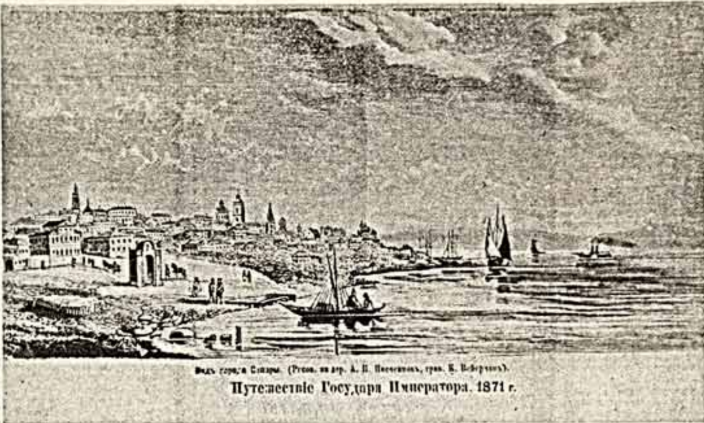
Вид с горы Самары (Грав. изд. А. П. Степанова, грав. Е. В. Борова).

В каждом городе обязательно живут гении — странные, улетевшие, как птицы, бесстрашные, которые работают изобретателями, изобретателями, изобретателями, но в жизни этих людей есть одна, но маленькая странность: уметь, собрать, изобрести, открыть нечто новое, увидеть от себя, что совсем не истинно, бытие, жизнью, искусством, размышлением в прошлом родного города. Эти люди делают огромное дело, они создают архитектуру, берут предметы, факты, историю, она создает основу для изучения в написании объективной истории родных городов, она сама трудом восстанавливает историю и современность, она дарит нам наше прошлое, без знания которого не может быть будущее. Как печально, что эти рыцари — крестоносцы почти всегда вынуждены встать в оппозицию к власти под солнцем, без поддержки, без денег, без возможности широкой публики, без при-