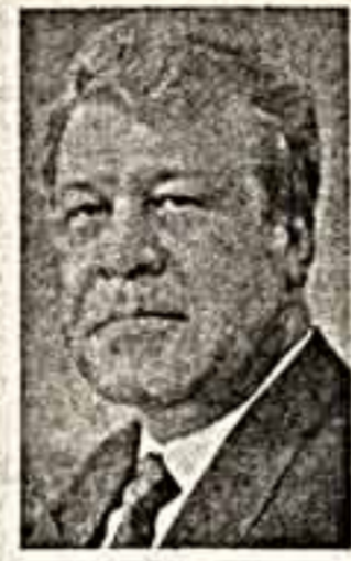
Когда речь идет о том, чтобы снять налоги вообще, правительству возражают и за счет них увеличивают вложения в культуру.

— Та сложная ситуация, в которой оказался ВАЗ, скажется ли на размерах вашей помощи культуре? — Нет. Создавая фонды, мы хорошо знаем, как это надо делать. Как создавать определенный резерв. То есть то, что часто не умеют, а может, и не должны уметь мастера культуры. Мы в свое время организовали депозитный счет. Это простая финансовая операция. На его основе создан благотворительный фонд, с этого счета мы спонсируем культуру и спорт. Этот счет не зави-