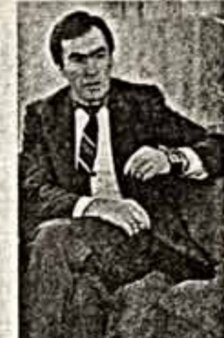
Или это было безрезультатно. И ни одно из государственных учреждений, призванных заниматься культурой (в первую очередь речь идет, конечно, о министерстве), не поддерживало нас, ни организация, подобная нашей. Мы сознательно всегда давали много информации о своей деятельности, издавая газету, «Обзорные культуры», информационные бюллетени, чтобы наш опыт кем-то анализировался, использовался, но — увы!

И если первый год мы еще имели льготное налогообложение, то потом у нас не стало и его. К кому бы мы ни обращались, сколько бы мы ни доказывали, что работаем только на культуру, а вовсе не на себя — все было безрезультатно. И ни одно из государственных учреждений, призванных заниматься культурой (в первую очередь речь идет, конечно, о министерстве), не поддерживало нас, ни организация, подобная нашей. Мы сознательно всегда давали много информации о своей деятельности, издавая газету, «Обзорные культуры», информационные бюллетени, чтобы наш опыт кем-то анализировался, использовался, но — увы!