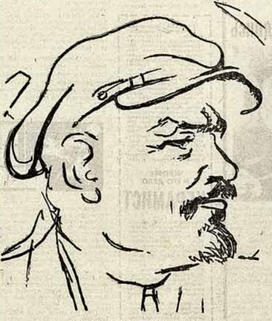
Ренато Гуттузо. В. И. ЛЕНИН. (Фрагмент).