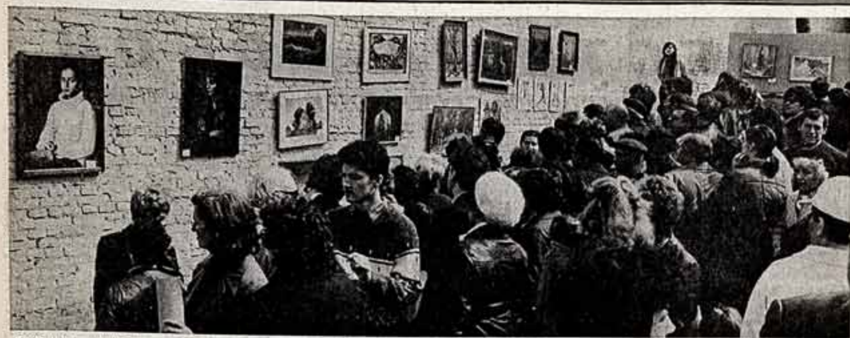
Улицы — наши кисти, площади — наши палитры. (На Андреевской улице в Киеве).