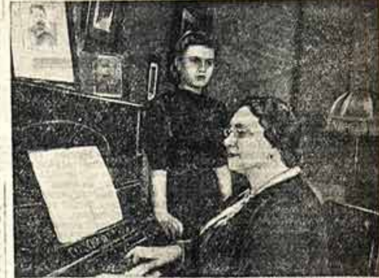
В нашей стране созданы все условия для культурного роста и успешного творческого развития людей, их способностей и талантов. Мы прилагаем все усилия, чтобы создать условия для творческого роста и успешного творческого развития людей, их способностей и талантов.