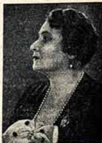
Счастливые воспоминания артистки Надежды Андреевны Обуховой.

Среди старшего поколения лучших представителей русского вокального искусства Надежда Андреевна Обуховая бесспорно принадлежит к выдающимся мастерам. Редкий по красоте голоса и выразительности исполнитель, обладающий уникальным даром артистического дарования Надежда Андреевна.