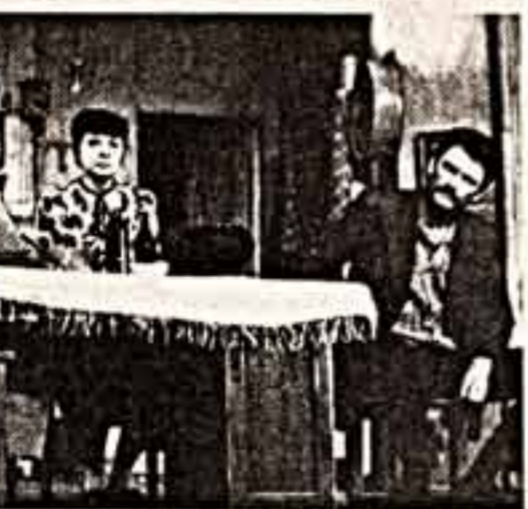
Сцена из спектакля «Вдвоем пародок».