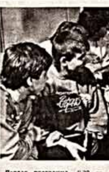
Сцена из спектакля «Вдвоем пародок».