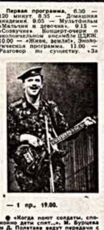
«Когда полет солдат, сплотившийся в «Фронте»...