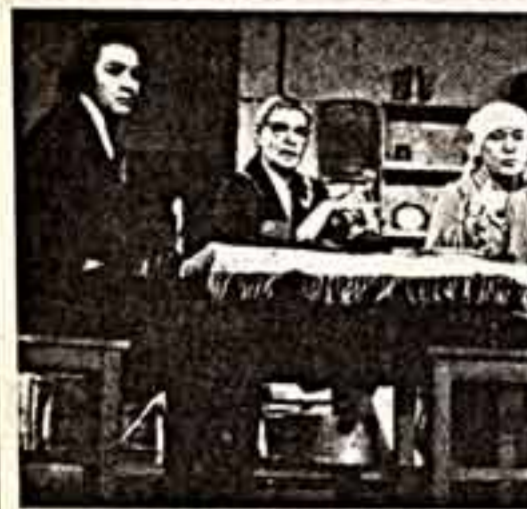
Сцена из спектакля «Вдвоем пародок».